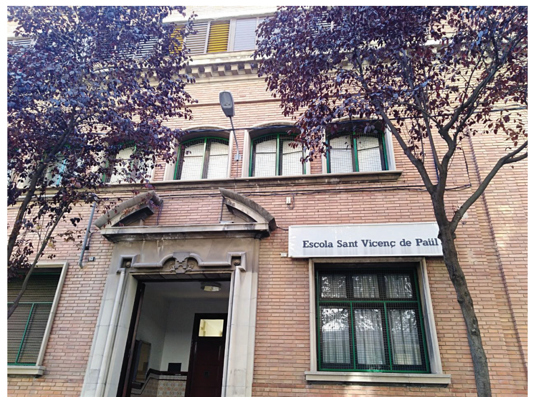
Foto: Façana de l'escola Sant Vicent de Paül

El centre ha tancat després de dos mesos de polèmica, tensions i mala gestió