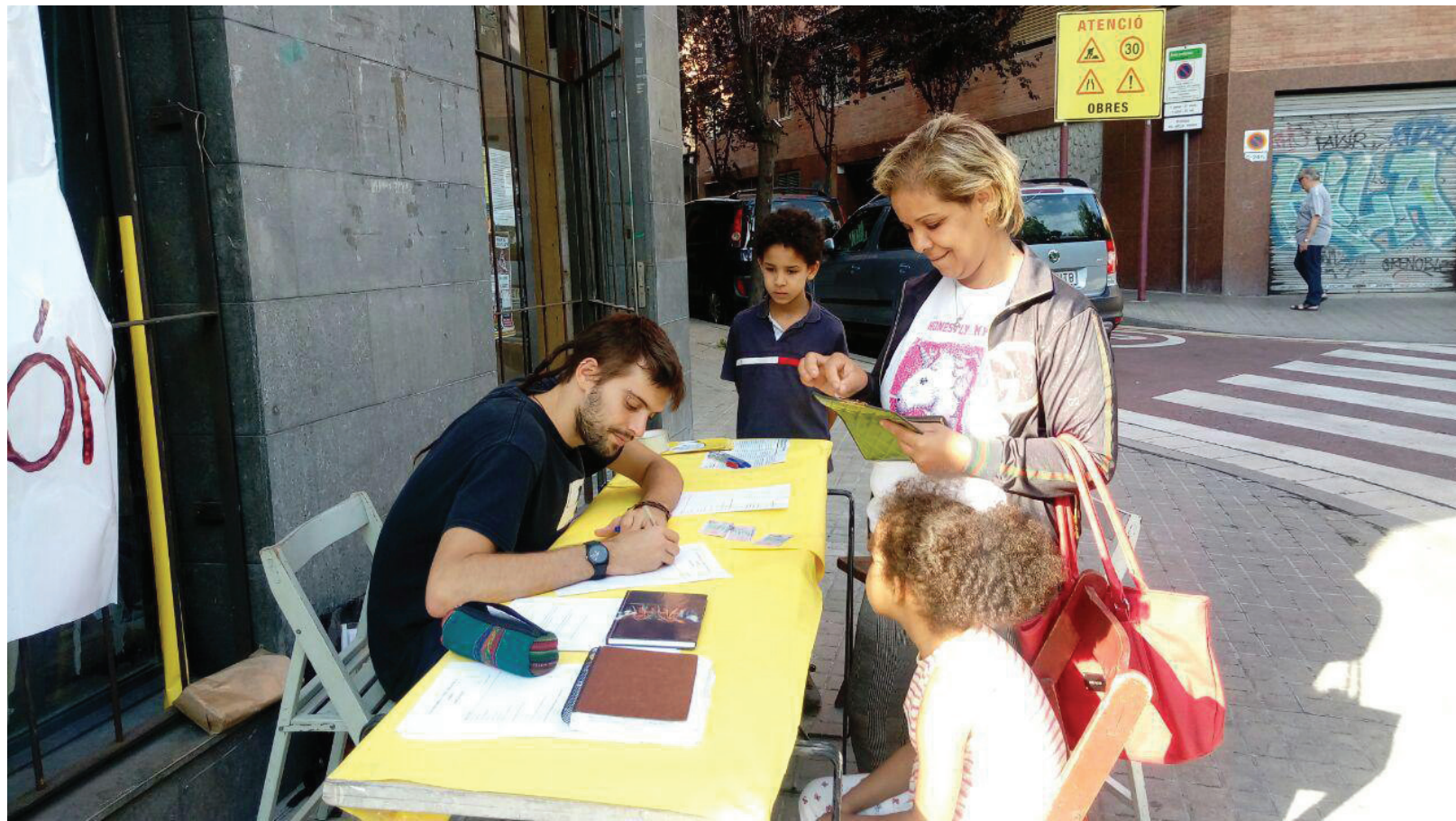
Primeres inscripcions a L'Escola Popular de La Bordeta

Entenem la pedagogia com un procés transformador de la societat i de la