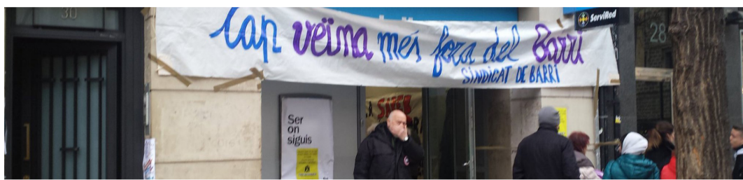
Els activistes per l'habitatge dins de l'oficina de Solvia.