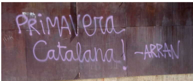
Primavera catalana! - Arran