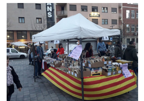
Una de les parades de llibres feministes.

10 de març, a rebu d'un 8 de març amb un èxit aclaparador tant a nivell de barri com de país, la Fira del Llibre Feminista de Sants neix com una proposta del moviment popular del barri per crear un espai d'autoorganització de les dones i els moviments feministes. Amb l'objectiu de ser un punt de trobada de les llibretries que treballen al barri per difondre recursos i materials bibliogràfics, creats per dones o de temàtica