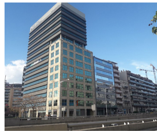
Seu de la empresa Faro Spain que participa de la indústria de la guerra.

Tinguem clar llavors, que quan veiem la guerra tranquil·lament des del televisor, tenim al costat de casa empreses que les fan possible, tinguem clar també que tenim les eines per a què això deixi de passar. N'hi ha prou en retirar els nostres estalvis d'aquelles entitats que inverteixen els seus dipòsits en la indústria militar.