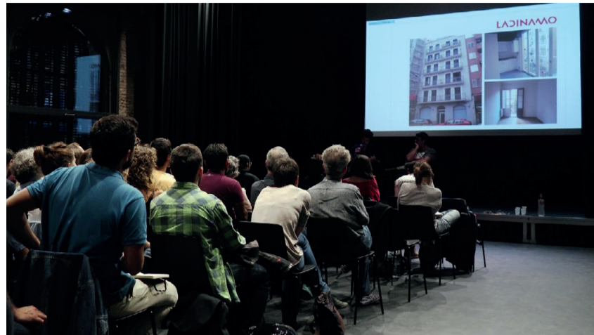
Presentació de la convocatòria oberta a la Lleialtat Santsenca el 26 d'octubre.

L'edifici, de titularitat de La Dinamo, se cedirà a la cooperativa adjudicatària a través d'un contracte