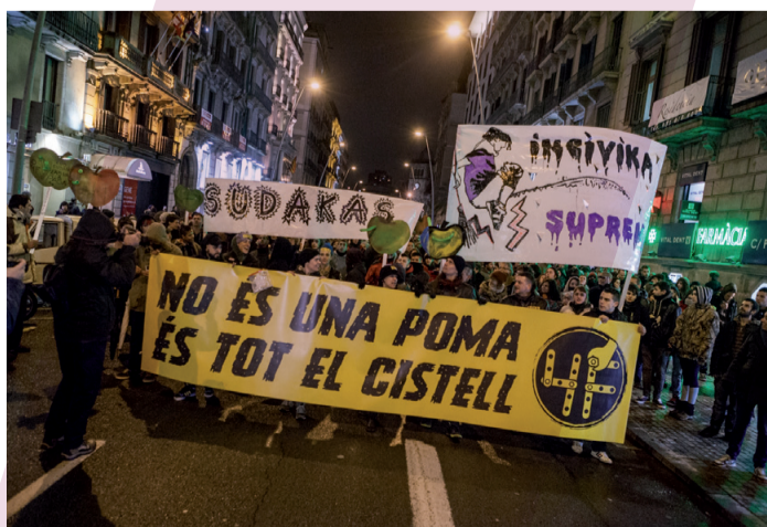
Manifestació en suport dels afectats del 4F

Podeu veure el documental Ciutat Morta a http://metromuster.cat/