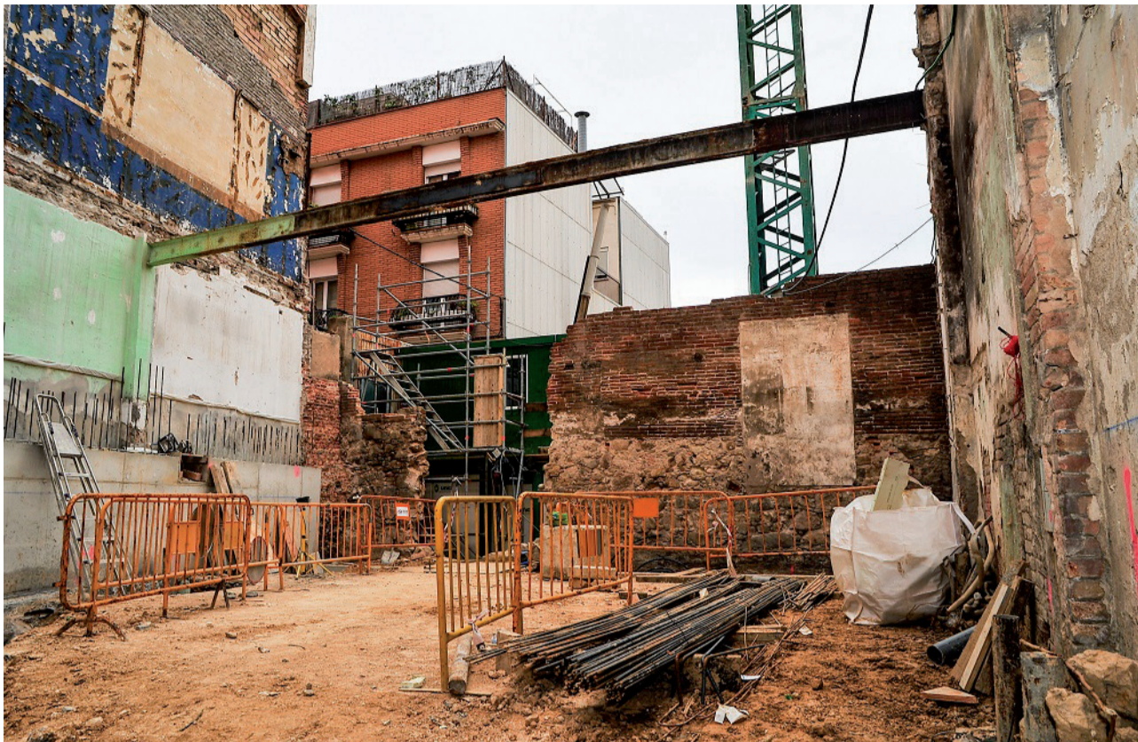
Visita a les obres de la Lleialtat Santseca.

D es dels últims mesos, quan veïns i veïnes caminen pel carrer Olzinelles, topen amb una gran obra que fins hi tot talla el trànsit per treballar amb gran maquinària. El passat dilluns 26 de gener les entitats del barri van poder observar, aquest cop des de dins, com avancen les obres per adequar l'edifici de La Lleialtat Santseca en un nou equipament veïnal. La visita va estar acompanyada de personal del Districte així com de tècnics d'H Arquitectes —l'equip responsable del projecte—. Tot i que només es va poder accedir a la planta baixa de l'edifici per qüestions de seguretat, les persones assistents van poder observar com ja s'havien realitzat la major part d'enderrocs necessaris per deixar pas als nous espais, a la vegada que s'havien reforçat les parts més interessants de l'edifici. Trobareu un reportatge fotogràfic de Josep Molins i Salip i de Jordi Soler a la web de la Plataforma www.lleialtat.cat . L'edifici original va ser aixe-