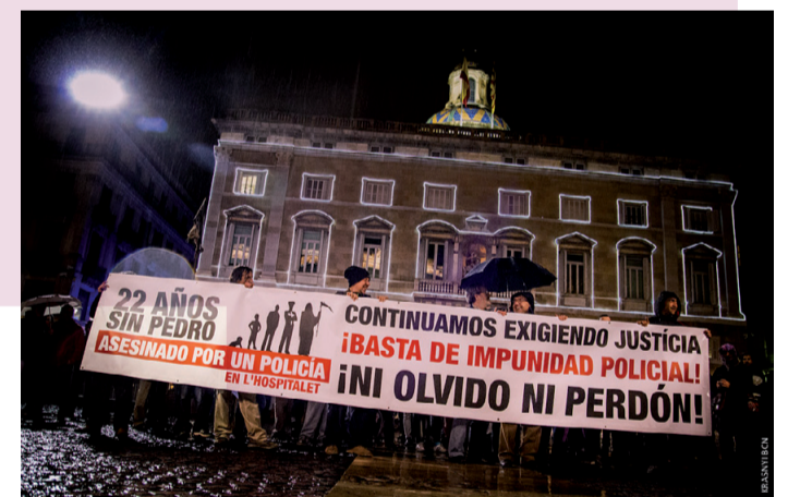
Accions de la plataforma Pedro Alvarez