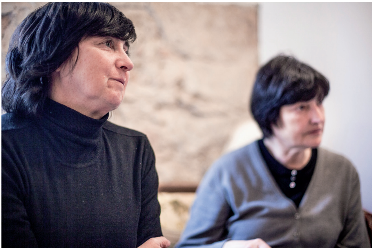
Familiars de represaliades durant les mobilitzacions de protesta contra el desallotjament de Can Vies