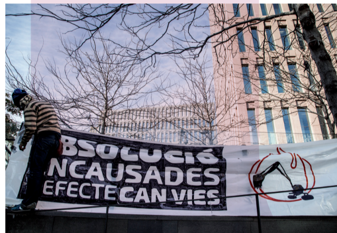
Concentració en suport a les encausades per l’Efecte Can Vies

[ http://canvies.barrisants.org/can-vies/ ]