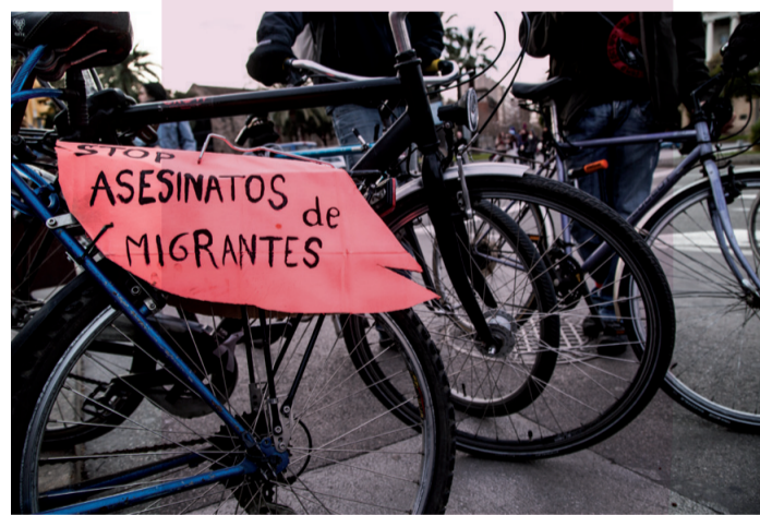
Massa crítica pels assassinats del 6F a Ceuta

[ http://tanquemelscies.blogspot.com.es ]