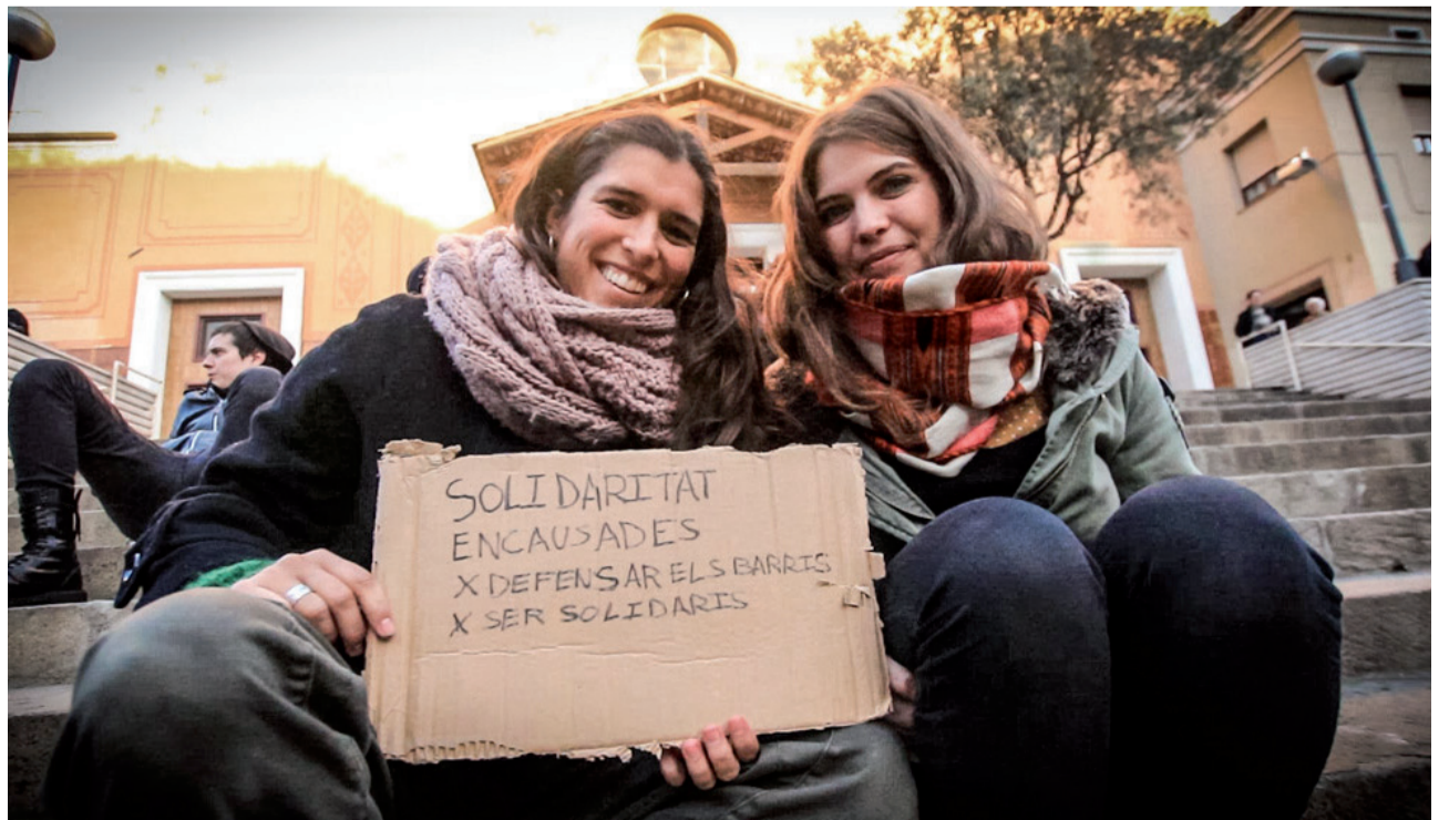
El barri es mobilitza en solidaritat amb les encausades

Rubia ha anunciat que presentarà una querrela contra els agents de la Guàrdia Urbana per fals testimoni, i dos recursos on demanarà una indemnització pel seu pas per la presó, i una amonestació per al jutge responsable per mala praxis.