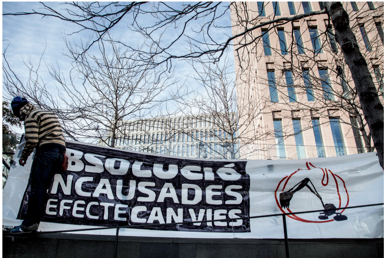
Concentració de suport davant dels Jutjats