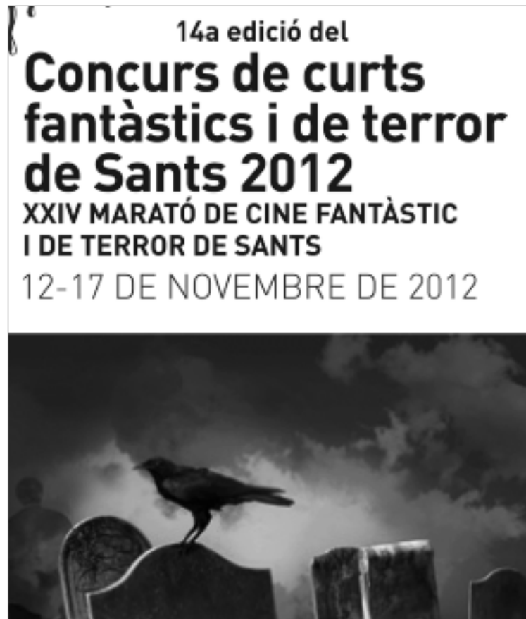
Cartell de l'edició 2012 de la Marató de Cinema Fantàstic i de Terror de Sants, Hostafrancs i la Bordeta celebrada a les Cotxeres de Sants.

Aquesta edició de 2012 s'ha vist també com la prova de foc per tirar endavant, amb el suport de les entitats del barri, el macroacte que s'espera celebrar l'any que ve en commemoració de la 25a edició del certamen, el qual no tenim cap mena de dubte que, vista l'evolució enguany en la quantitat i procedència de produccions presentades i de públic assistent, serà un nou èxit més que rotund.