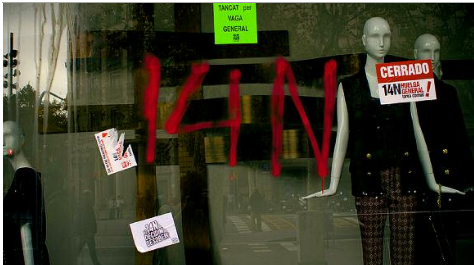
Botigues tancades durant la vaga general. TERESA FORN

La jornada del passat 14N, dia de vaga general, va ser tot un èxit a Sants. Els piquets quedaren a les 8 del matí per recórrer els carrers del barri i informar a les veïnes i a alguns dels pocs establiments que no havien tancat. La presència policial fou constant, amb furgonetes ARRO tancant la marxa de les vaquistes. A les 12h els piquets s'ajuntaren amb l'Assemblea Grogà, que va organitzar una cassolada i després va marxar pel carrer de Sants per acabar a plaça Espanya.