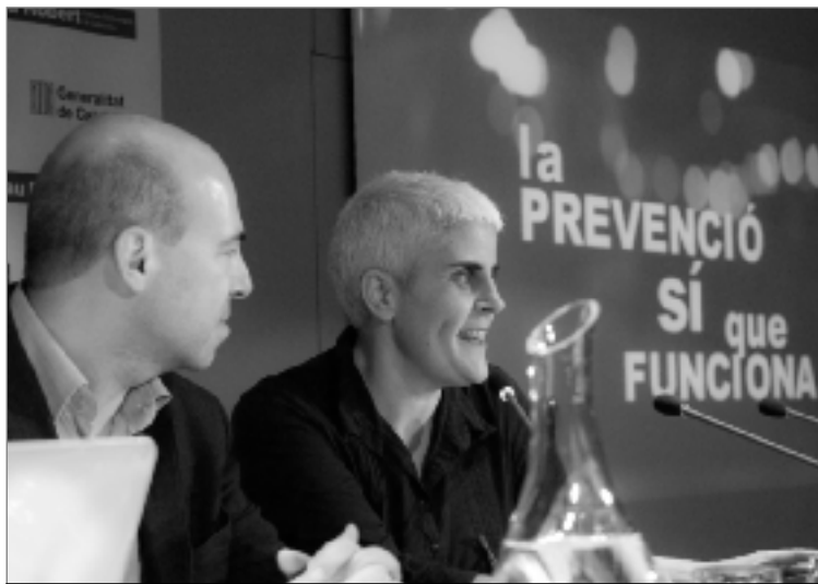
Acte en el marc del Dia Mundial de la Sida. COMITÈ 1R DE DESEMBRE

El dissabte 1 de desembre fou una data marcada per les dràstiques retallades que el govern de Mariano Rajoy ha fet a les diverses estructures de l'estat de benestar. Les entitats del Comitè 1 de Desembre, aquest any coincideixen mes que mai en les seves denúncies i exigències: les retallades tiraran per te-