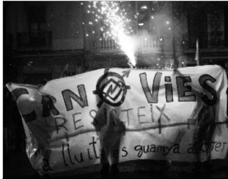
El cercavila va aplegar més de 500 persones tot i la ràpida convocatòria. VÍCTOR OBREGÓN

Davant l'altre front obert que té Can Vies contra TMB per evitar-ne el