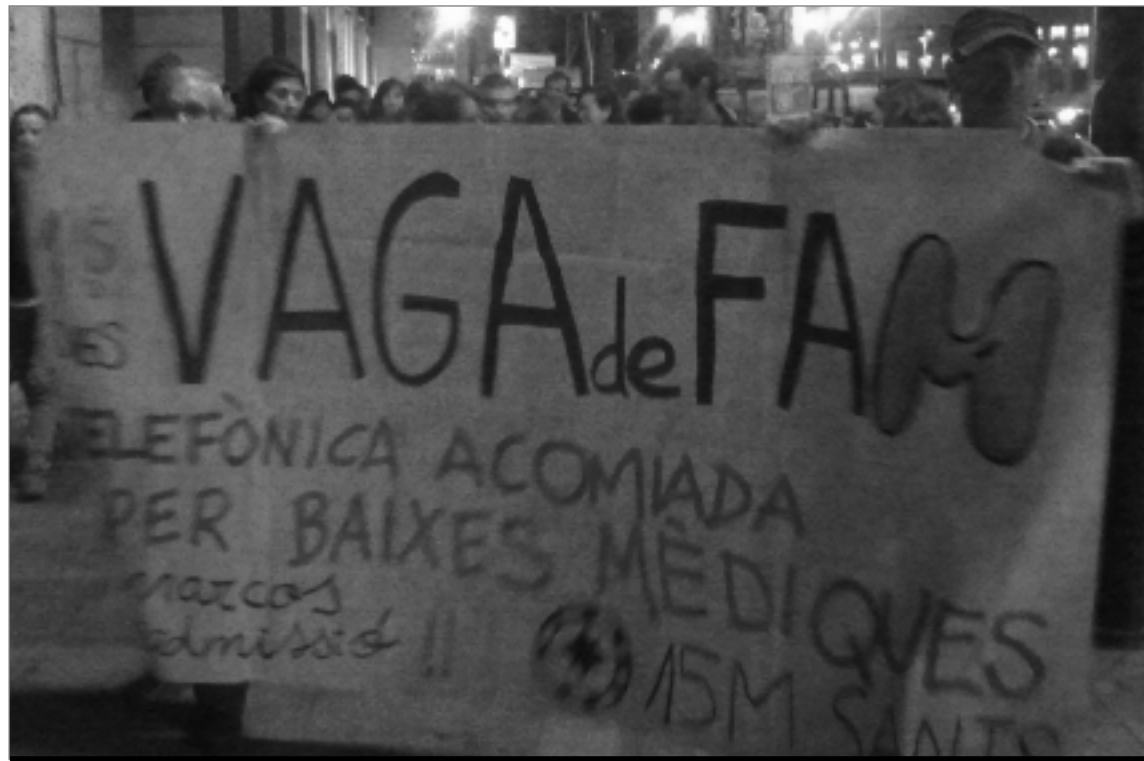
L'Assemblea Indignada de Sants es mobilitza en suport a la lluita dels treballadors de Telefónica. ASSEMBLEA INDIGNADA DE SANTS

Cinc treballadors han estat 23 dies sense menjar denunciant els acomiadaments per baixes mèdiques justificades i la readmissió d'un treballador amb vint anys d'antiguitat.