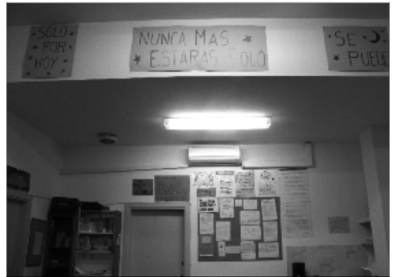
Local de l'Associació al carrer Leiva 41.

El programa que AA suggereix es basa en dotze passes dissenyades per a la recuperació personal de l'alcoholisme. El primer pas és presentar-se davant la comunitat amb el reconeixement explícit de tenir el problema de l'alcoholisme. Continuen identificant-se com a alcohòlics, i encara que portin anys sense beure alcohol no diuen que estan curats. Així, a les sessions, cada persona explica la seva experiència amb l'alcohol i la resta d'assistents l'intenten ajudar. Són sessions a porta tancada i anònimes, en què hi ha persones de perfils molt