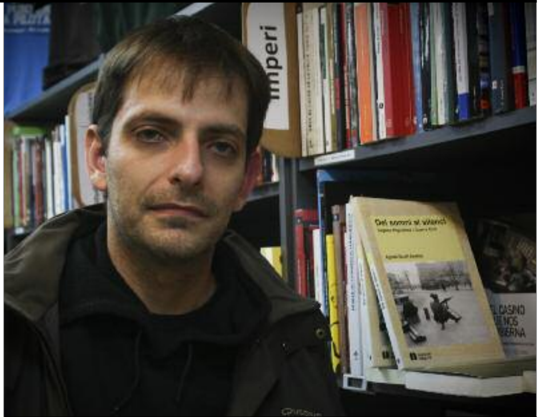
L'Agus a la llibreria La ciutat invisible, on podem trobar el seu llibre. ÀNGEL BRAVO ALMIRALL

Cert. Per exemple, la dècada que tracto al llibre és un moment de confrontació màxima, però també moltes coses que fins ara eren al món de les idees, en aquella època es van portar a terme. Aquí pots llegir per exemple com a Can Batlló es produïen explosius, i això et pot portar a interessarte per les col·lectivitats de les fàbriques.