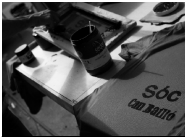
El Bloc 11 és un dels espais amb més vida del barri.

La Plataforma Recuperem Can Batlló s'activa amb molts projectes gestionats pel veïnat.