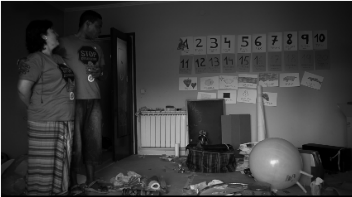
Desnonament de l'Elisa i la seva parella. VÍCTOR OBREGÓN

immediat, de les problemàtiques actuals, tant socials com ecològiques i econòmiques, i dels moviments populars que ens fan avançar.