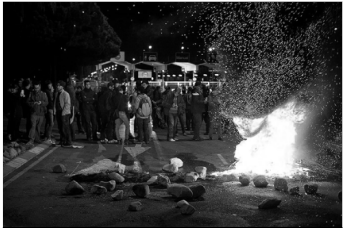
MercaBarna va ser un dels punts calents de la vaga.

Les més de 200 persones que portaven recorrent els carrers de Sants des del matí confluïren amb l'Assemblea Grog a les 12 h a plaça de