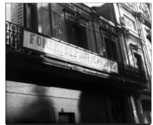
Fotografia de l'antic foment republicà de sants.