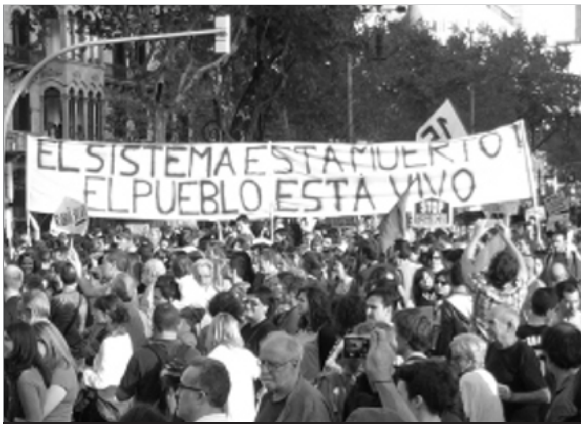
Manifestació del Primer de Maig pels carrers de Barcelona.

La manifestació unitària de la tarda va ser convocada per la Coordinadora Laboral i de Suport Mutu del 15M i anava encapçalada per un bloc de persones sense banderes o adscripció política-sindical i a continuació aplegà a la Intersindical, al bloc de les Feministes Indignades, el Sindicat Ferroviari, Co.Bas, organitzacions polítiques anticapitalistes, organitzacions d'immigrants, el bloc de l'esquerra independentista, i el bloc llibertari. La pancarta unitària contrastà amb la del matí. Si al matí els carrers de Barcelona CCOO i