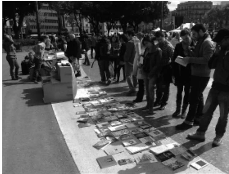
Quatre biblioteques autogestionades de Sants van participar a l'acció.

Van haver-hi reaccions molts disperses. Alguns no sabien si emportar-se'ls o no, d'altres volien fer alguna aportació econòmica, i fins i tot, algunes persones va interessar-se en com