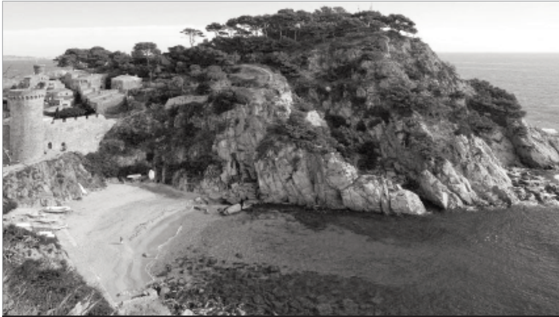
Zona d'Es Codolar on es vol construir el port de luxe.

immediat, de les problemàtiques actuals, tant socials com ecològiques i econòmiques, i dels moviments populars que ens fan avançar.