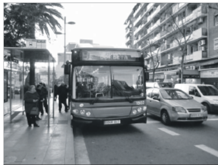
Aspecte que presenta la parada del bus de barri un dia entre setmana. LA BURXA

Fins l'11 de març, 2.095 persones van signar per que el 91 i 115 circuli cada dia. Signatures que van ser entregades al districte per la Comissió de Veïns de la Bordeta.