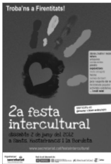
Programa de la Festa que es podrà trobar properament complet a la pàgina web.

La Taula intercultural del Secretariat d'Entitats de Sants, Hostafrancs i la Bordeta organitza per segon any la Festa Intercultural.