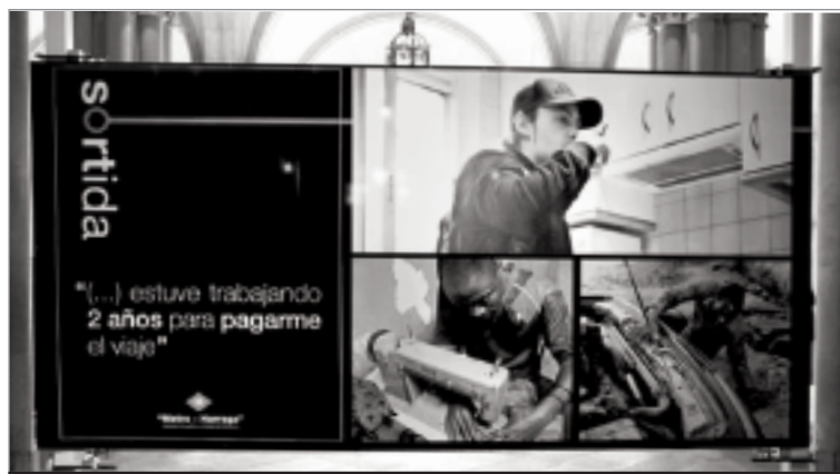
Imatge d'un dels plafons de l'exposició. UB-INTERNET

Més de 60 persones amb barrets, bufandes, abrics i guants en naus a sota zero, van començar a traçar un nou camí conjunt per l'imaginari col·lectiu dels barris de Sants.