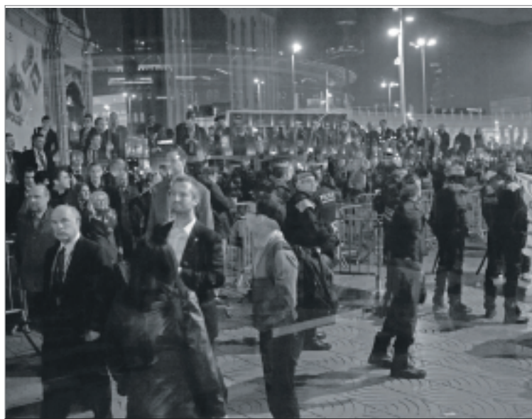
Els Mossos d'Esquadra van fer un cordó policial per protegir els congressistes que al veure la concentració a les portes del MWC van sortir corrent, tot i que no s'havia produït cap tipus de situació de tensió. VÍCTOR OBREGÓN

Totes les grans marques de mòbils i aplicacions hi eren presents a plaça d'Espanya. Dins el programa del congrés, aquestes vergonyes no es van tractar.