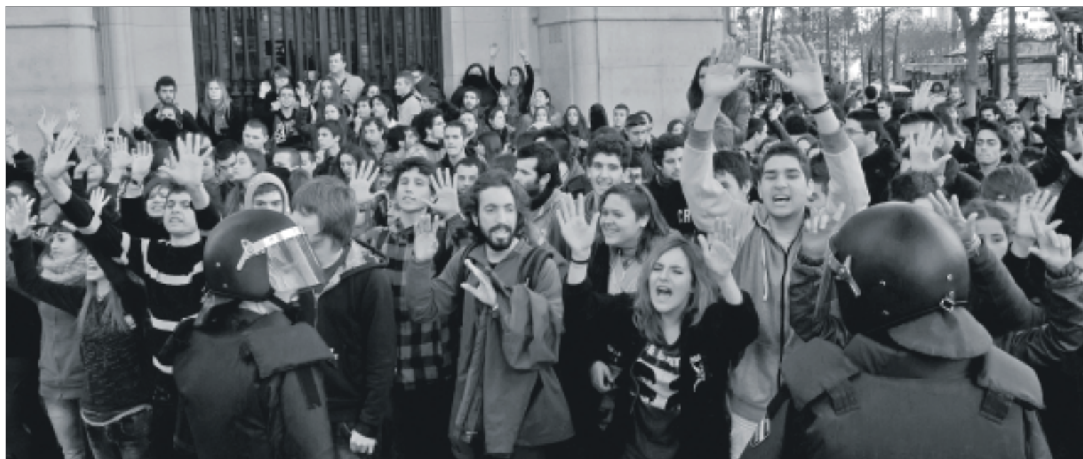
Protestes estudiantils enceses a València.

immediat, de les problemàtiques actuals, tant socials com ecològiques i econòmiques, i dels moviments populars que ens fan avançar.