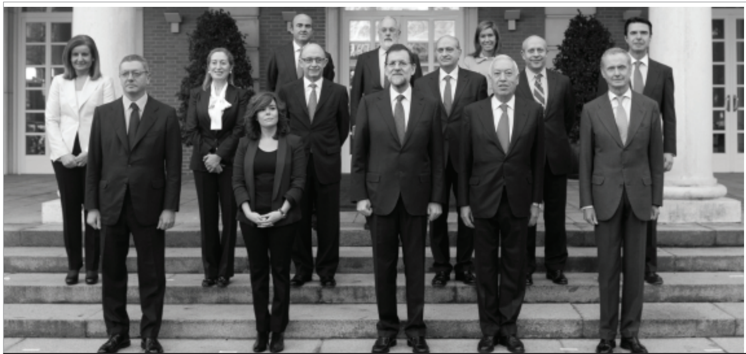
Imatge de l'actual govern responsable de la reforma laboral.

En definitiva, les jornades «Pensar el moment» han estat una oportunitat per aprofundir en debats, posar en comú experiències i retrobar-nos després de més de mig any fora de la plaça. Una parada per recarregar piles i continuar prenent el carrers.