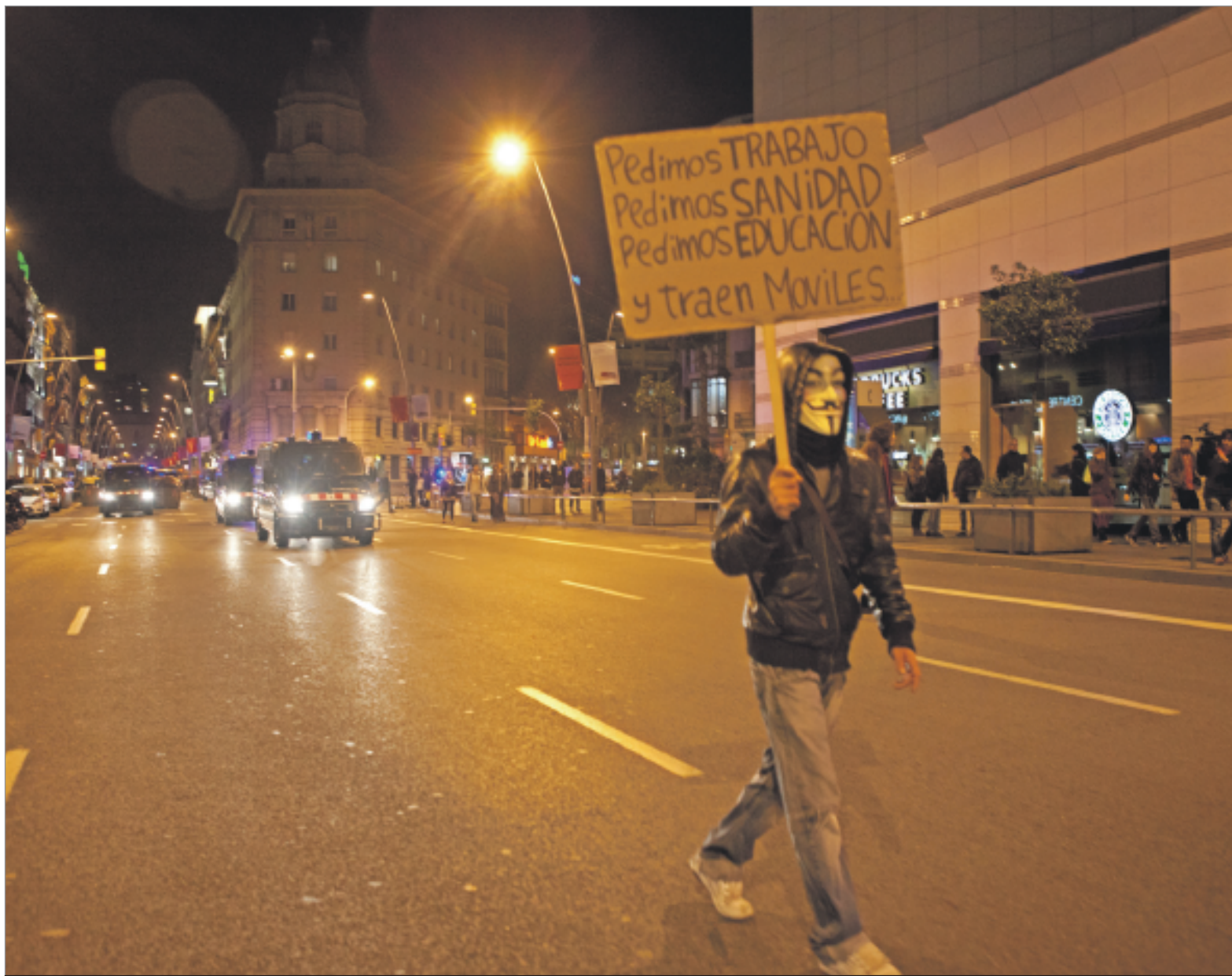
Les reivindicacions pels drets socials i les crítiques a la indústria del mòbil van aplegar nombroses persones a la plaça d'Espanya. VÍCTOR OBRIGÓN

Treballadores que veuen amenaçats els seus drets laborals, estudiants que protesten per les retallades en la qua-