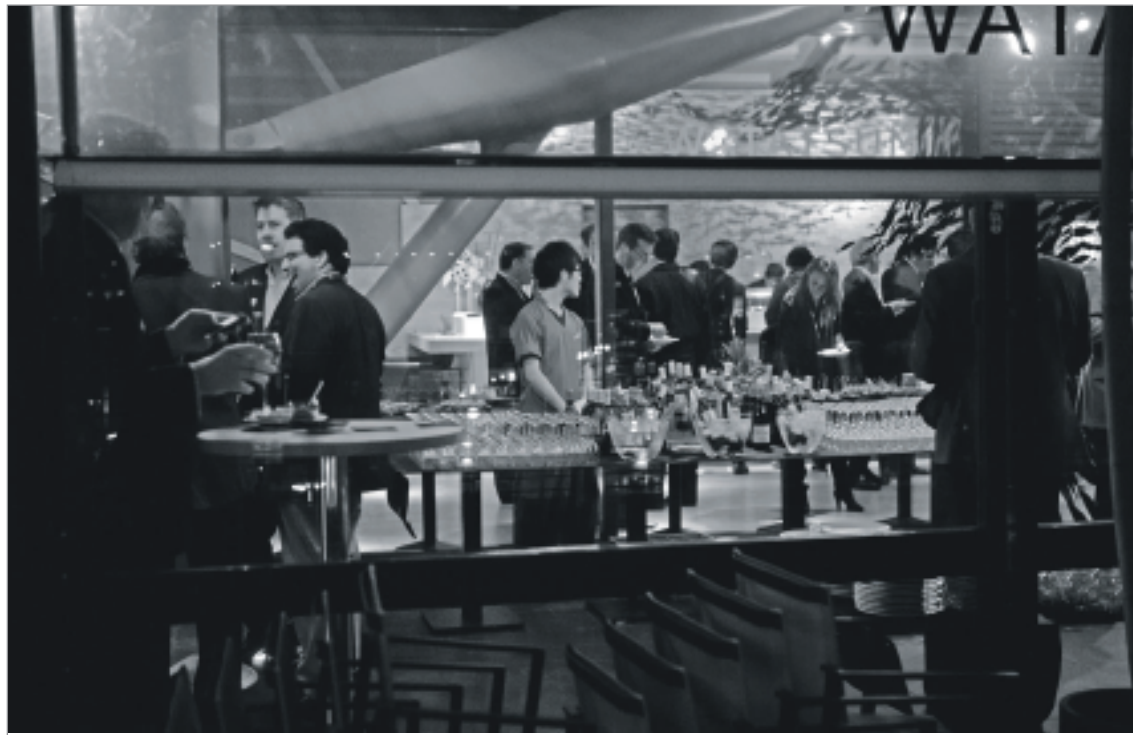
Els i les assistents al MWC van poder gaudir d'una gran oferta de luxe a la ciutat. Mentrestant, centenars de persones es manifestaven a la plaça Espanya. VÍCTOR OBREGÓN

manifestació hi havien infants i adolescents. Amb samarretes grogues i pancartes reclamaven més mestres, més qualitat a l'ensenyament i l'atenció particular que cada menor precisa.