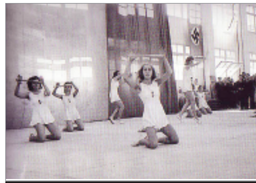
Les joventuts hitlerianes a l'Espanya Industrial l'any 1941.