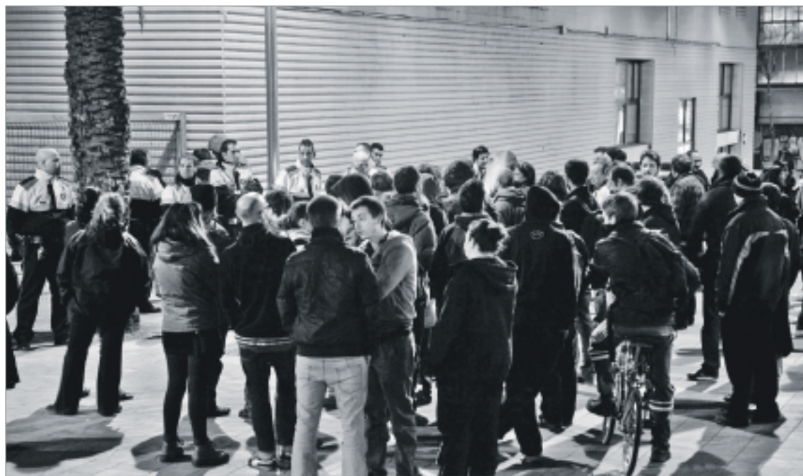
Desenes de persones es concentraren en solidaritat amb els treballadors i treballadores del supermercat. ROBERT BONET

persones, una de les quals en negar-s'hi va ser traslladada a la comissaria. Una setmana després, han estat cridades a un judici de faltes per desobediència, tot i que l'atestat confirma que no hi va haver incidents destacables.