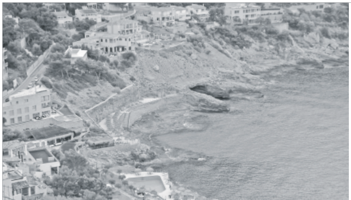
La zona de Cala Llamp pateix des de fa anys els efectes de la construcció desmesurada a la costa.

immediat, de les problemàtiques actuals, tant socials com ecològiques i econòmiques, i dels moviments populars que ens fan avançar.