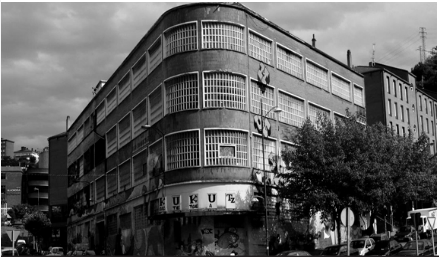
Kukutza III abans de ser enderrocada. KLAUS ARMBRUSTER