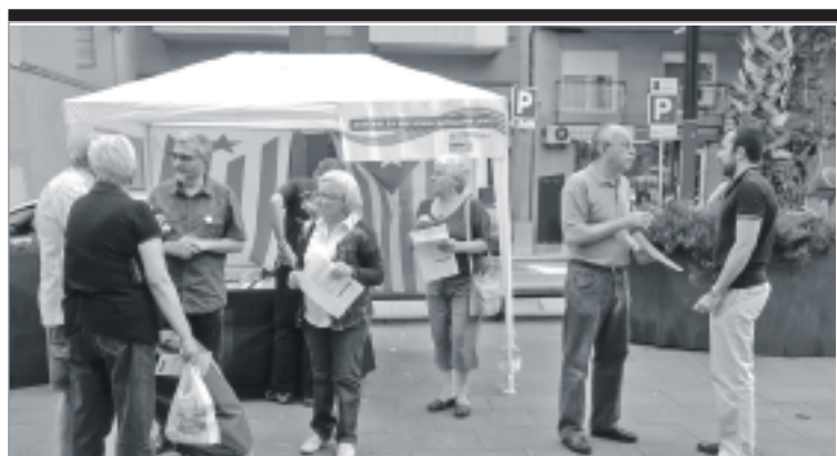
SMXI ha muntat diferents paradetes per explicar el projecte. Sobre aquestes línies, una paradeta a la rambla de Badal. SMXI

Al Casal Independentista de Sants Jaume Compte es pot visitar l'exposició «Paraules immigrades», un treball fet per alumnes d'ESO de l'escola Llobregat que pretén fer conscients els visitants que les paraules, com les persones, vénen d'arreu i van arreu i conformen la història d'un pilar de la nostra cultura: la llengua.