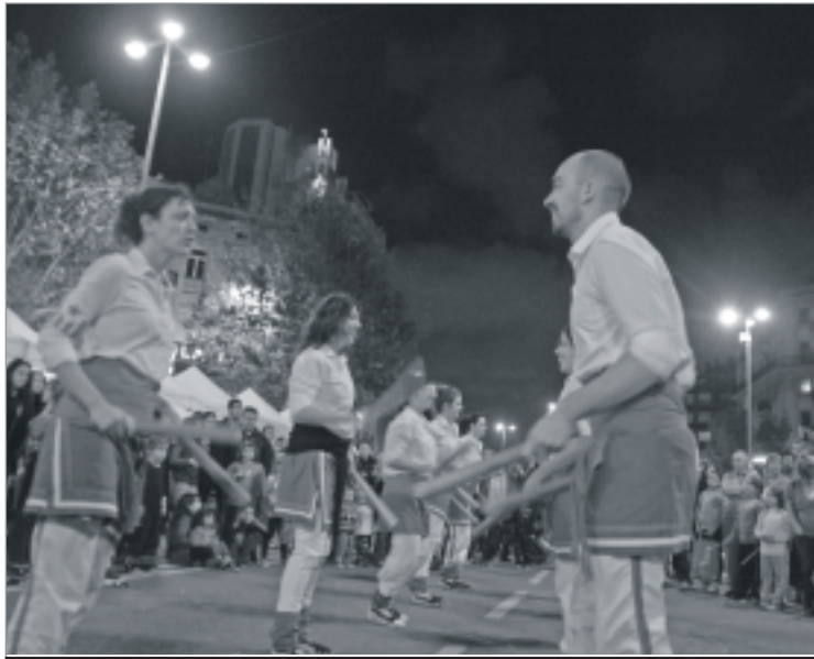
La Colla Bastonera desperta amb força després de dos anys de letargia. QUIM PERELLÓ

Cal destacar el retorn de la reviscolada Colla Bastonera després de dos