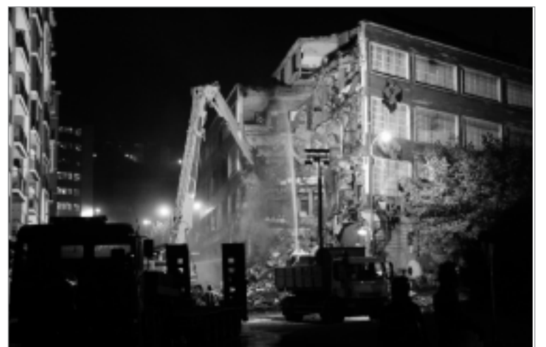
Kukutza III en el moment de ser enderrocada. KLAUS ARMBRUSTER

El que queda ara és un descampat però també unes experiències, una xarxa i un suport social que serà difícil trencar. Malgrat que les dinàmiques han quedat truncades, la feina de Kuku continua per recuperar-se del cop rebut i aixecar-se de nou. Un article menyspreava la feina desenvolupada al centre social fent una burda comparació entre el cucut, au que pon els ous a niu que no són el seu, i els ocupes. Però, Kukutza s'assembla més a un fènix que en comptes del foc reneix de la runa.