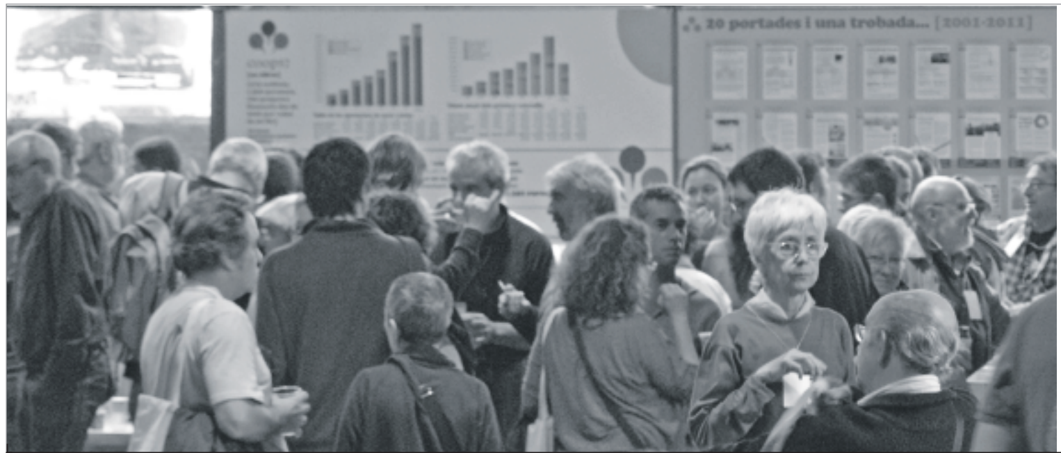
La trobada cooperativista va aplegar centenars de persones a les Cotxeres de Sants. LA BURXA