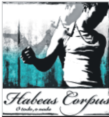
Portada de l'últim disc d'Habeas Corpus.

Divendres 26 és la nit d'homenatge a Esteve Fortuny i, en conseqüència, de la presentació d'un espectacle molt especial preparat per a l'ocasió per la santsenca Companyia Elèctrica Dharma que portarà per títol «El retorn d'un so màgic» i que representarà la