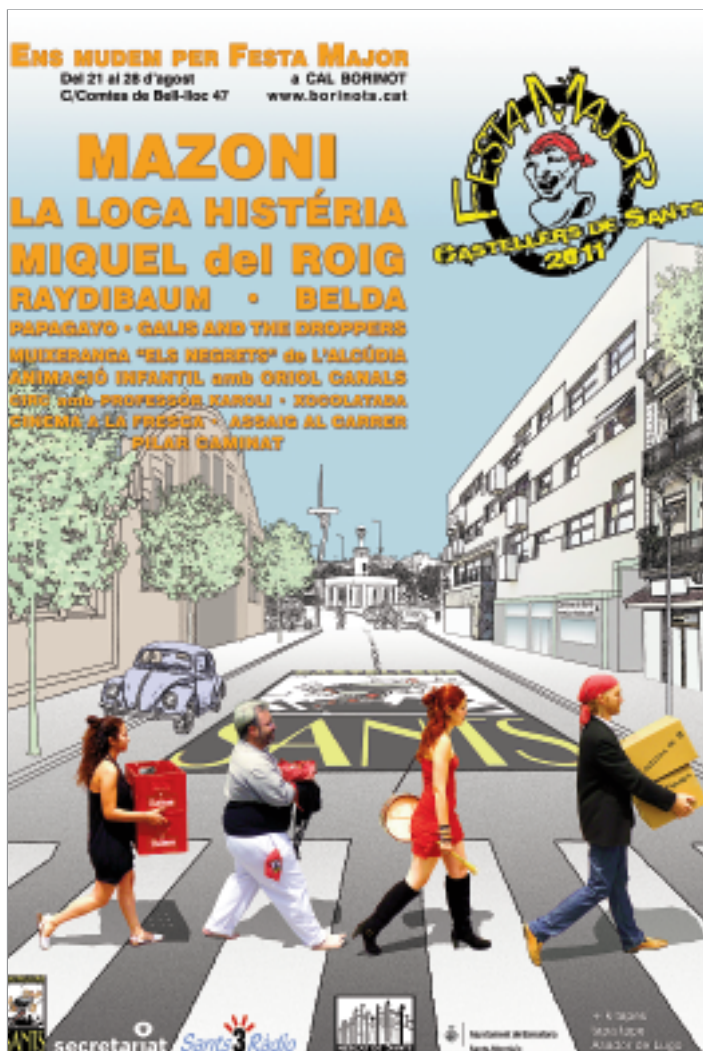
Alguns dels cartells que veiem penjats al nostre barri: el de la Federació (dalt a l'esquerra) i el dels Castellers de Sants (dalt a la dreta)