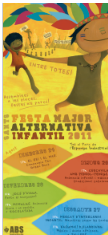
Aquest any, de nou, la Festa Major Alternativa (dalt a la dreta) anima a participar tant als més grans com als més menuts. El cartell de les activitats infantils de la Festa Major Alternativa (dalt a l'esquerra).

Els diners que es treuen de les festes serveixen per finançar les festes de l'any vinent i per sufragar les despeses de l'Assemblea de Barri de Sants: publicar LA BURXA, mantenir el nou projecte de ràdio Sants Ona Lliure, i cobrir campanyes, com les d'enguany amb dones migrants, a part d'altres despeses d'infraestructura i antirrepressives. Els diners es guarden al Coop57, un projecte de banca ètica. Totes les persones que treballen a les festes ho fan de manera voluntària i militant.