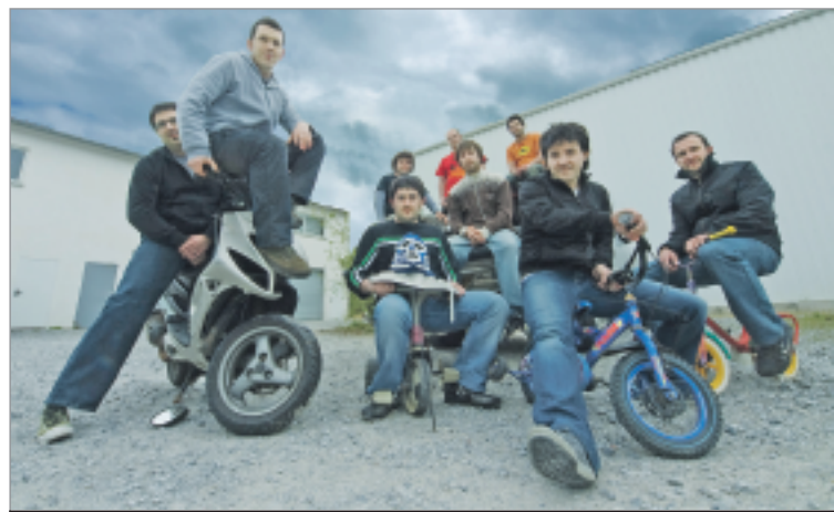
Esne Beltza, grup que tocarà a la FMA el dijous 25 a la nit.

Per acabar, la música electrònica dels madrilenys Dremen que tindran l'oportunitat de donar per tancada la Festa Major Alternativa 2011 al barri de Sants.