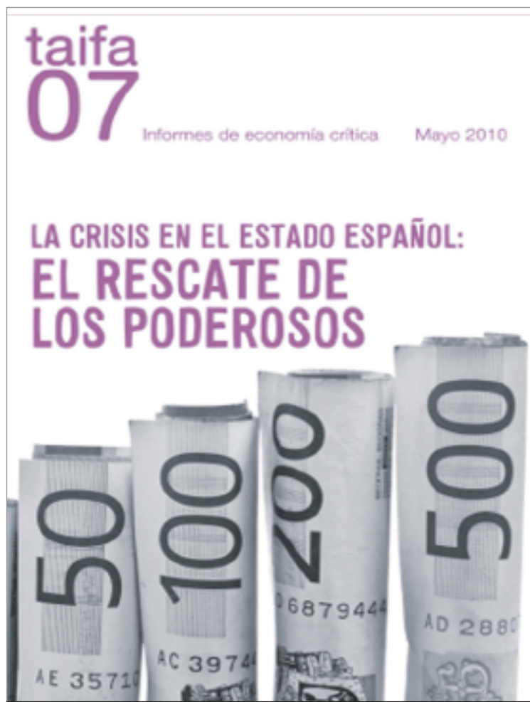
imatge de l'últim informe del Seminari Taifa.

Comptem també amb un grup dedicat a l'elaboració de cursos i materials de formació en economia com a