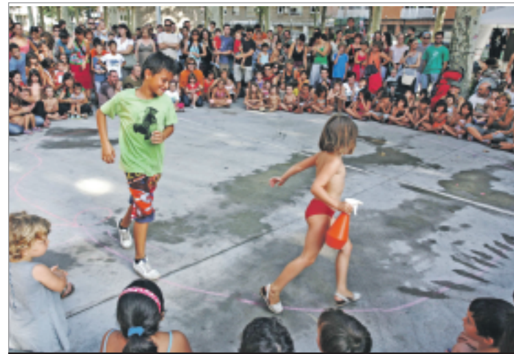
La Festa Major Alternativa Infantil es consolida com a espai de trobada de les més petites durant les festes del barri: segona edició a l'Espanya Industrial. ALBERT GARCIA