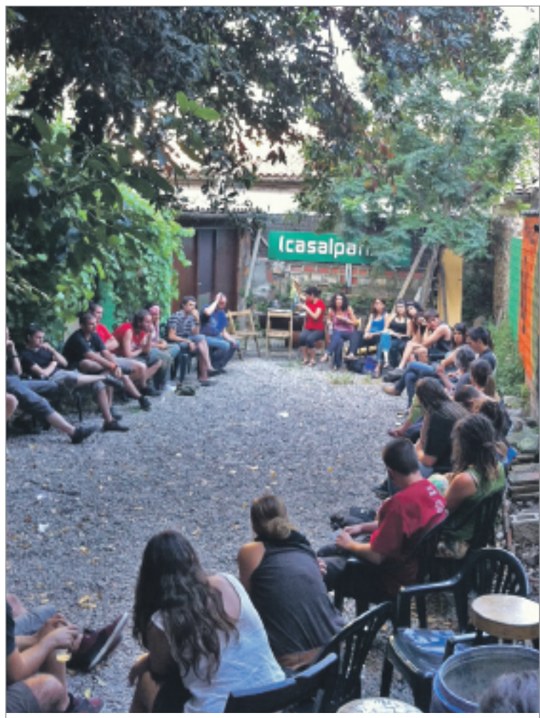
Una de les xerrada-debat del Rebrot 2011.

immediat, de les problemàtiques actuals, tant socials com ecològiques i econòmiques, i dels moviments populars que ens fan avançar.