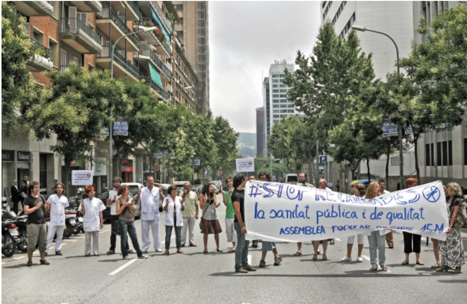
Els treballadors i les treballadores del CAP de Numància s'han concentrat els dimecres per mostrar el seu rebuig davant les retallades que ja estan patint alguns centres o hospitals com el Dos de Maig, que tancarà el setembre.

El Districte ha prohibit el correfoc previst el divendres 26 i emmarcat dins de la Festa Major Alternativa. El motiu és que dos correfocs (l'oficial i el de les alternatives) amb dos dies de diferència no són viables.