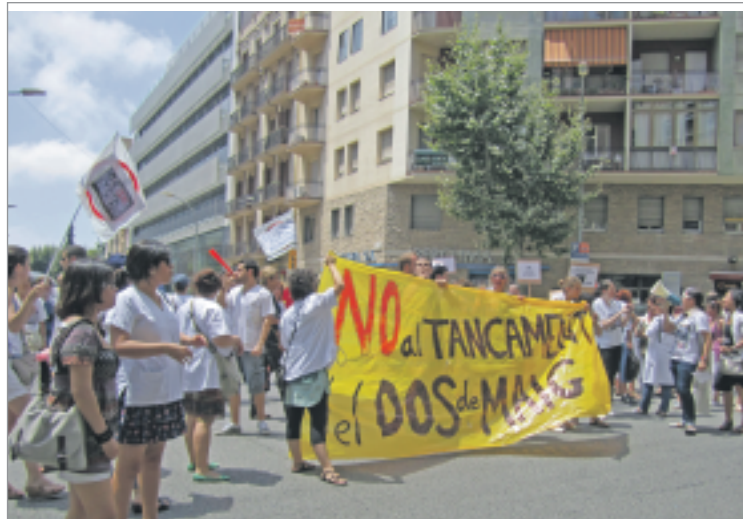
Concentració el dia 10 de juliol davant l'Hospital Clínic en contra del tancament de l'Hospital Dos de Maig. IRENE JAUME GAMBIN

La segona mesura de la majoria de centres hospitalaris passa pel tancament de llits i plantes. L'Hospital de Bellvitge, per exemple, tancarà dues plantes d'hospitalització i una tercera els caps de setmana. Això es tradueix en 48 llits menys i un estalvi de 2 milions i mig d'euros. L'Hospital Clínic tampoc se n'escapa de la reducció, amb el tancament previst d'entre 50 i