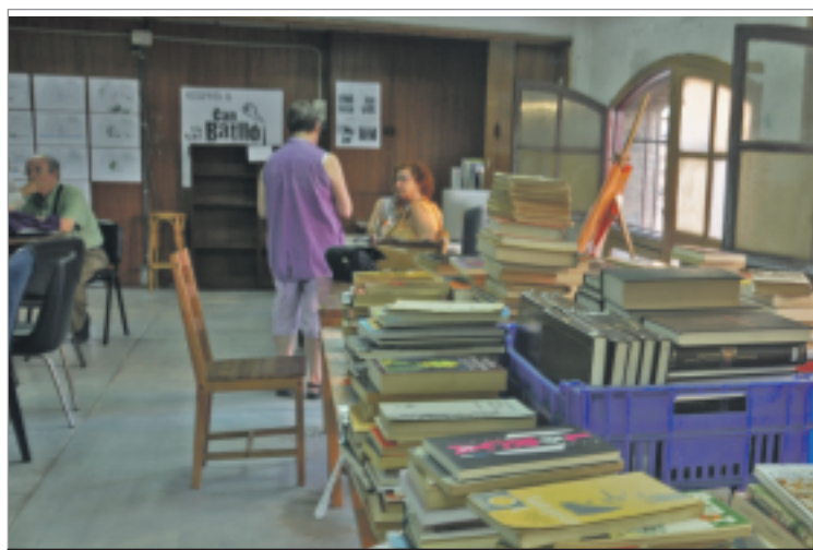
La biblioteca funciona amb el treball voluntari dels veïns i les veïnes que s'apunten als tornos de permanència.

més. Ofereix gratis préstec, repàs de primària i secundària, club de lectura, conferències i tertúlies. Els voluntaris fan tornos de 2 hores. Cataloguen, ne-