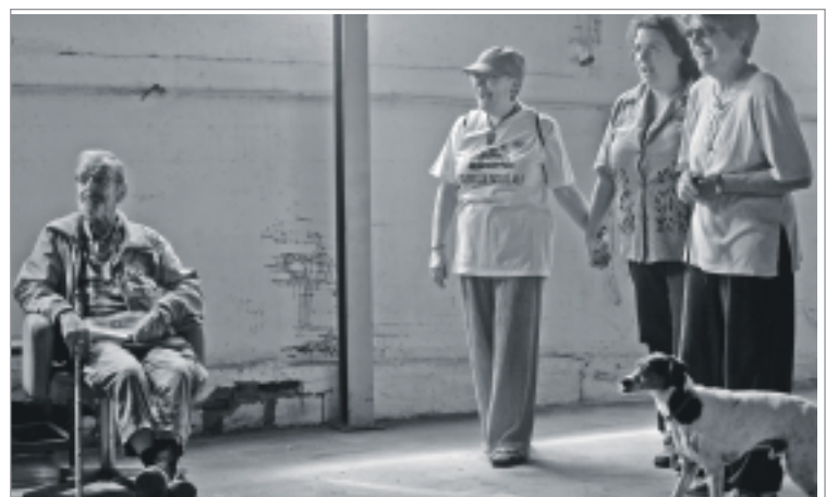
L'alegria es va instal·lar al cos dels veïns i les veïnes que tenien un somriure dibuixat a la cara, conseqüència de l'emoció. ALBERT GARCIA