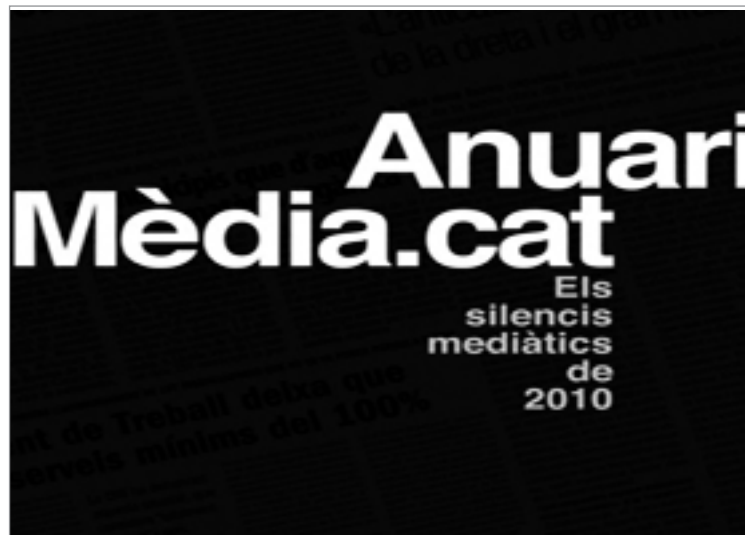
imatge de l'anuari.