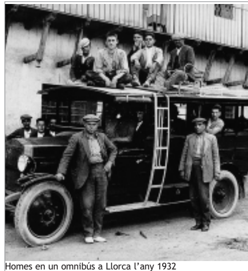
Homes en un omnibus a Llorca l'any 1932