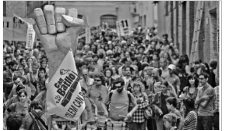
Un miler de persones van entrar per la porta principal del recinte de Can Batlló, acompanyats de colles de cultura popular i un puny gegant. ALBERT GARCIA

Més informació: http://canbatllo.wordpress.com