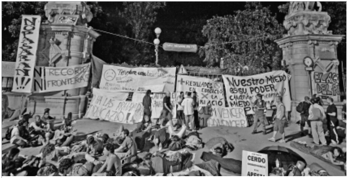
El 14 de juny es va acampar a les portes del Parlament i molta de la gent que va sortir des de Plaça de Sants s'hi van quedar a passar la nit i poder donar suport a la concentració del dia següent.

Des de l'Acampadasants s'ha participat en diferents iniciatives sorgides a l'Acampadabcn de Plaça de Catalunya, i compartides per assemblees i acampades de 93 barris i pobles catalans. Es va sortir en manifestació des de la Plaça de Sants el 14 de juny per participar a l'acció del 15 de juny de bloqueig de la sessió del Parlament de debat d'uns pressupostos que retallen drets socials. Més de 4.000 persones van participar al bloqueig que va dificultar l'accés dels parlamentaris i visibilitzar la indignació popular. L'acció va acabar amb diverses persones detingudes i ferides durant les cà-