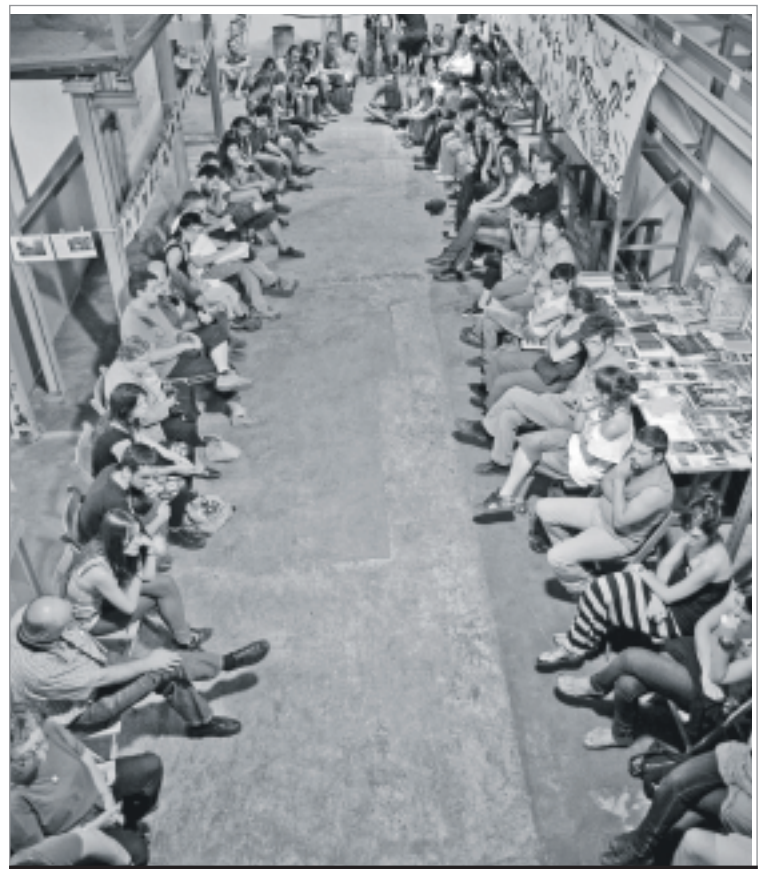
L'assemblea del diumenge va aplegar més de 70 persones. ALBERT GARCIA