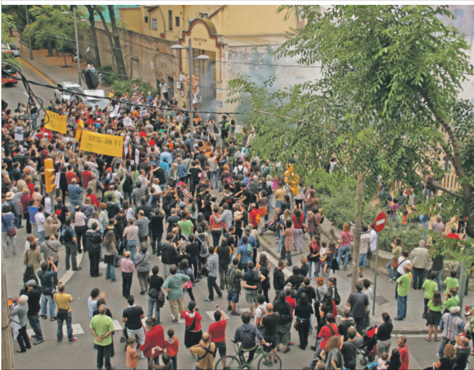
Instant en què s'obrí la porta i el veïnat accedí al recinte de Can Batlló l'11 de juny. MIRTA

PÀGINA 10 El llibre RT#15M: connectades a la xarxa, coordinades a les places, presentarà un recull d'imatges i una tria de tweets i hashtags com a memòria col·lectiva del moviment de les acampades des del 15 de maig fins a la manifestació del 19 de juny. Els beneficis derivats de l'edició del llibre es destinaran als mitjans de comunicació alternatius que han donat cobertura a les mobilitzacions.