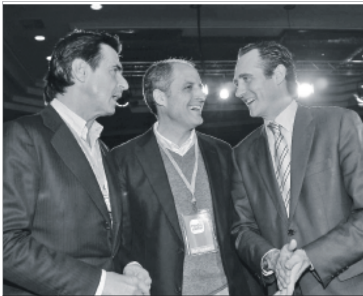
Camps i Bauzá són del sector més espanyolista i dretà del PP, que defensa postulats molt polèmics envers el català. Aquest fet ha repercutit al partit, on s'han viscut tensions internes per aquest tema.

immediat, de les problemàtiques actuals, tant socials com ecològiques i econòmiques, i dels moviments populars que ens fan avançar.