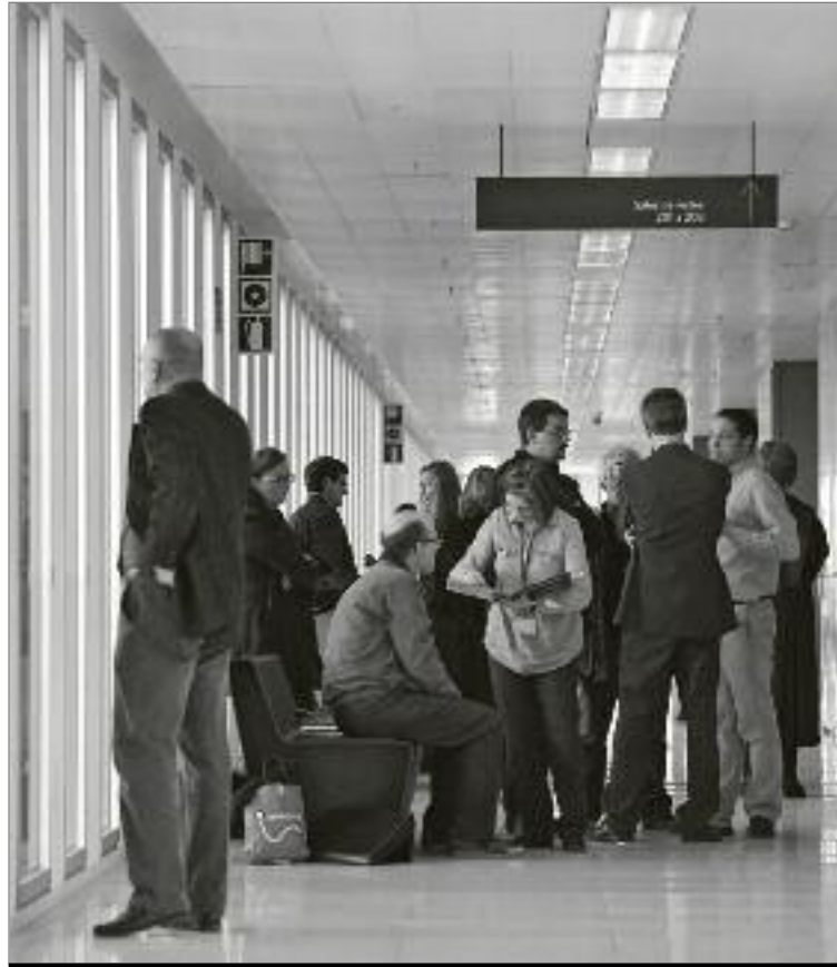
Els advocats esperaven el començament del judici als passadissos de la Ciutat de la Justícia, on no es va permetre l'entrada de la premsa. ALBERT GARCIA

TMB va ratificar la demanda que va interposar el 2010 contra totes les entitats que es van personar al darrer procés judicial contra el Centre Social Autogestionat (CSA); per la seva banda, la defensa de Can Vies va argumentar certs defectes de forma i de fons en la demanda interposada per TMB. Un dels defectes argumentats per la defensa del CSA Can Vies és el fet que la CNT no va ser citada al procediment, fet que va ratificar els representants de la CNT al mateix judici. Per aquest motiu s'entén que el procediment no s'ha portat a terme de forma adequada, per tant, la vida del CSA Can Vies al barri de Sants a de romandre amb normalitat. Un cop exposats tots els arguments, el judici va quedar vist per a sentència.