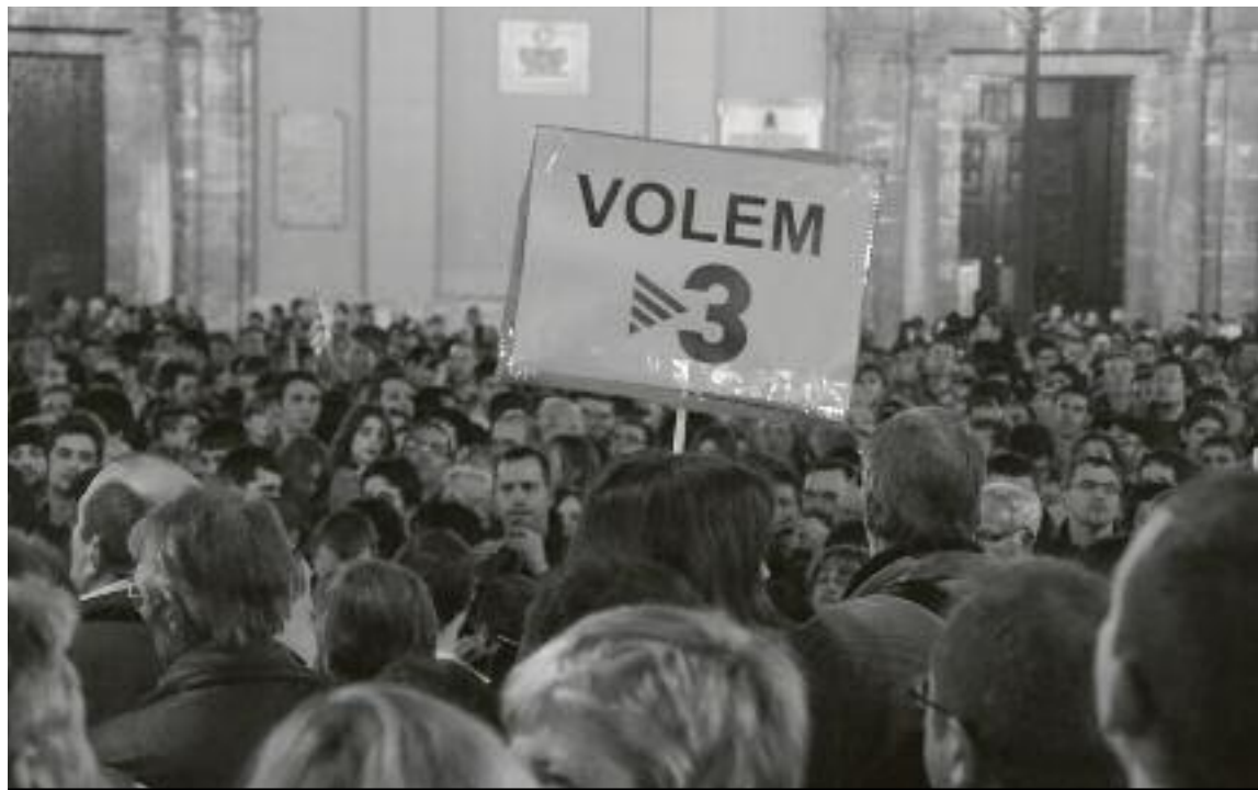
Moltes persones del País Valencià han volgut sortir als carrers per reivindicar que el Televisió de Catalunya es pugui veure a tot el territori i han omplert places d'arreu. L'ACCENT

immediat, de les problemàtiques actuals, tant socials com ecològiques i econòmiques, i dels moviments populars que ens fan avançar.