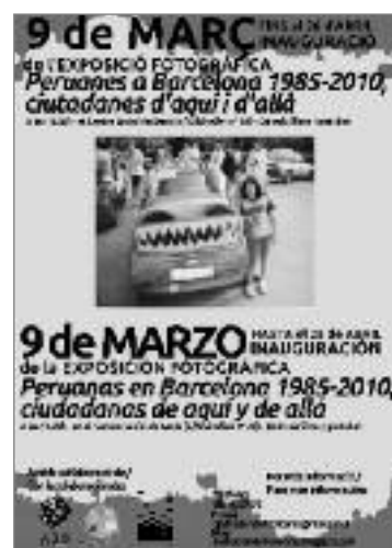
Cartell de l'exposició.

Més informació: http://deshaciendofronteras.blogspot.com