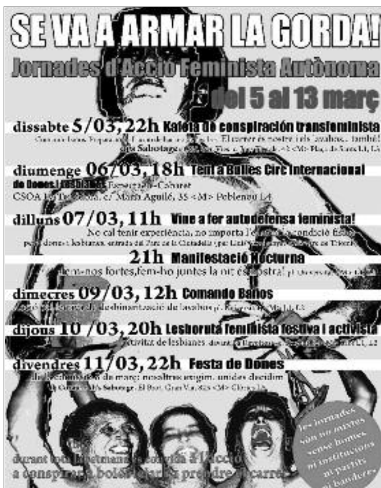
Programació de les Jornades d'Acció Feminista Autònoma. ASSEMBLEA TRANSFEMINISTA

Dins del marc d'aquesta setmana, la proposta compta amb un taller d'autodefensa feminista, un espectacle-cabaret del Circ Internacional Tent à Bulles, una manifestació nocturna i una lesbo-ruta feminista festiva i activista, entre d'altres accions i intervencions, totes elles no mixtes. Des de l'Assemblea Transfeminista hem organitzat una kafeta de conspiració per a dones, lesbianes i trans, que