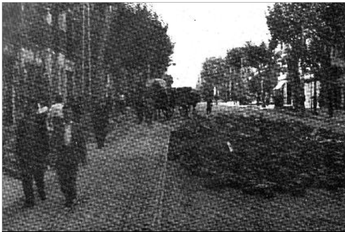
Fotografia que reflecteix l'aspecte de la carretera de Sants arran dels Fets d'Octubre de 1934.

El 2011 s'obre amb la fita que suposarà la recollida de vot anticipat per la consulta del 10 d'abril a la capital catalana, on tots som necessaris. Sovint però atribuïm el creixement de la consciència nacional sols als mals que venen d'Almansa, oblidant el treball i els sacrificis previs de milers de catalans. La crònica que segueix aquestes línies, uns apunts sobre la història de l'independentisme a Sants, els pretén homenatjar.