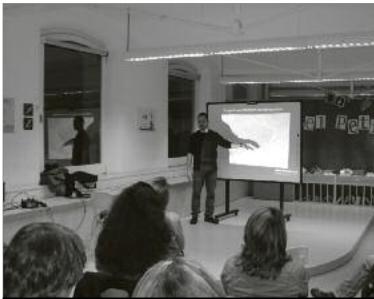
Xerrada a la biblioteca Vapor Vell dins el primer cicle de xerrades. DANI CORTIJO

Al febrer s'ha celebrat a la biblioteca del Vapor Vell el primer cicle de xerrades 'Altres Barcelones', una aproximació a alguns dels aspectes més curiosos de la història de Barcelona.