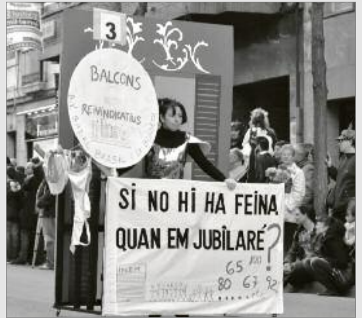
Flicker Bart Omeu

Un any més, el nostre barri ha volgut celebrar la festa del Carnestoltes. El dissabte 5 de març la Rua va sortir del creuament entre Carretera de Sants i carrer Badal i va comptar amb la presència de més d'una vintena de carrosses. Al matí, però, es va celebrar el Carnestoltes infantil al parc de l'Espanya Industrial.