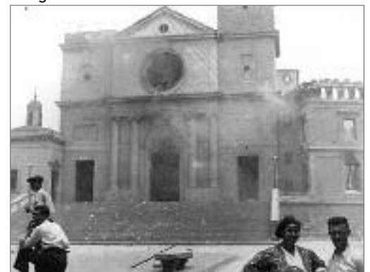
L'església de Santa Maria de Sants cremada. Agost de 1936.