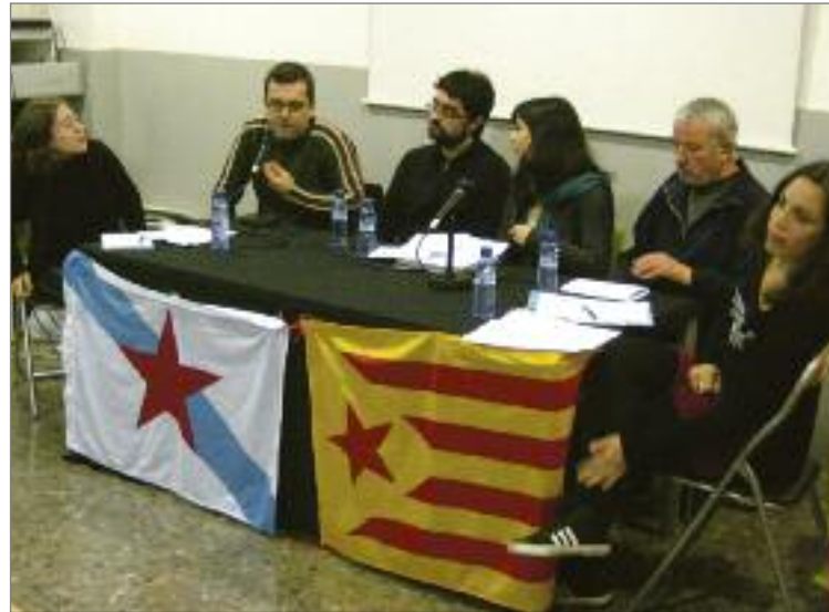
Xerrada durant la Jornada sobre Galícia. CASAL INDEPENDENTISTA DE SANTS

JORNADES CELEBRADES Fins aquest moment s'han dut a terme les jornades d'Astúries, Galícia i Castella. La primera de les jornades va tenir lloc el 15 de gener i el país convidat va ser Astúries. La jornada va començar amb un dinar popular amb menjar típic asturià que va comptar amb una trentena de persones, va