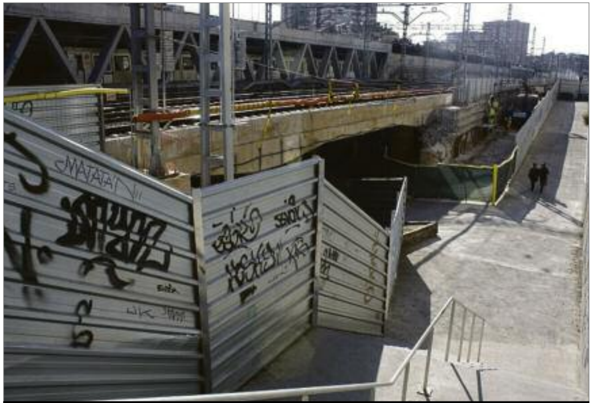
Accés al Metro de Mercat Nou, al costat del mercat. ANGEL BRAVO

Les obres començades el gener per cobrir les vies de rodalies i l'inici de la següent fase del mercat de Sants perpetuen l'espera dels i les veïnes dels carrers Sant Medir, Sant Jordi, Daoiz i