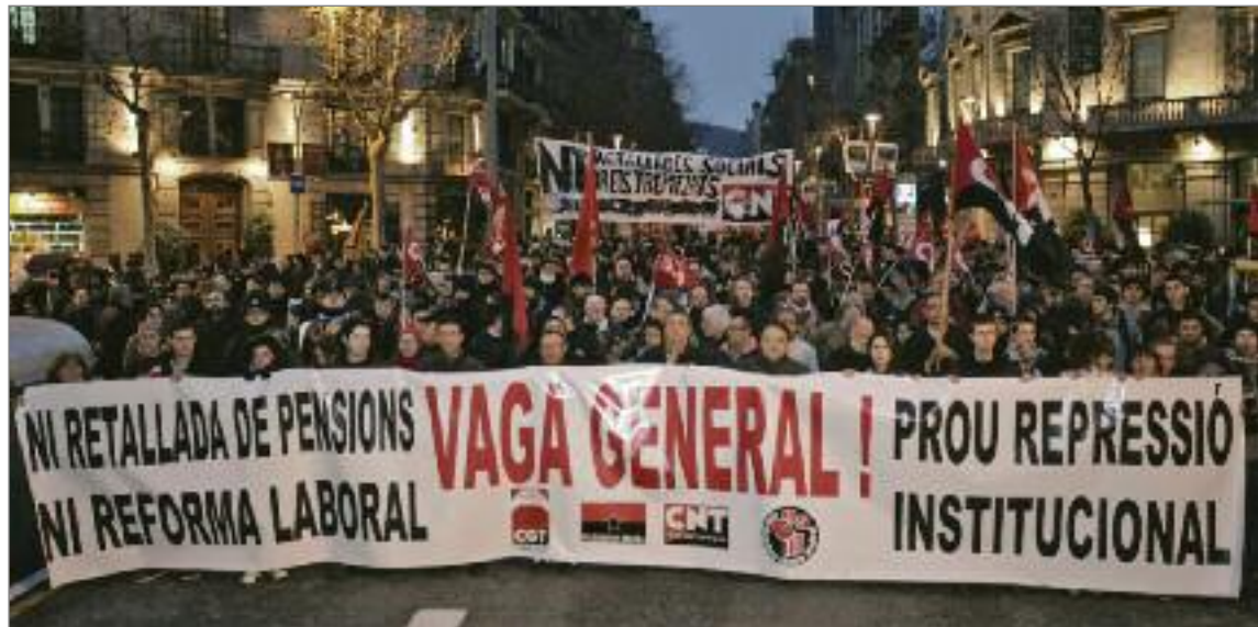
La manifestació més multitudinària va ser la de Barcelona, que va recórrer els carrers de la ciutat des de Jardinetes de Gràcia fins a la plaça de la Catedral. ALBERT GARCIA

immediat, de les problemàtiques actuals, tant socials com ecològiques i econòmiques, i dels moviments populars que ens fan avançar.