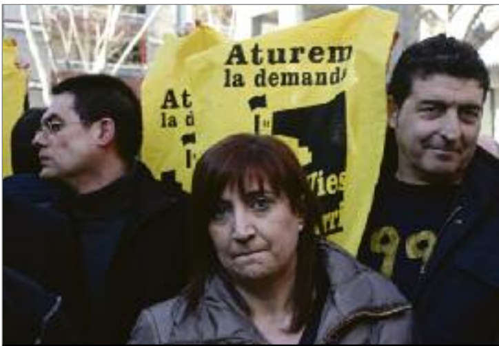
Una de les accions de suport que s'han dut a terme per denunciar la situació en què es troba el centre social. ALBERT GARCIA

El Centre Social Autogestionat (CSA) Can Vies s'enfronta, el 18 de febrer, a un nou judici. TMB i l'Ajuntament tornen a la càrrega i volen que Can Vies desaparegui del barri. Però no tothom pensa igual. Accions de protesta com la de la fotografia, on una desena de persones van ensenyar banderoles del