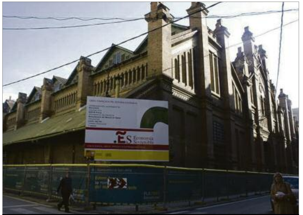
Les obres de reforma del mercat, que van començar el 2009, està previst que acabin el 2013, any del centenari.

Segons fonts recents, un futur propietari haurà de pagar 2.400 euros per metre quadrat. Tenint en compte que una parada estàndard té unes mesures de 5 per 2,5 metres, la xifra és de 24.000 euros. I cal sumar la despesa en equips, càmeres i mostradors que en total sumen uns 35.000 euros aproximadament per concessionari.