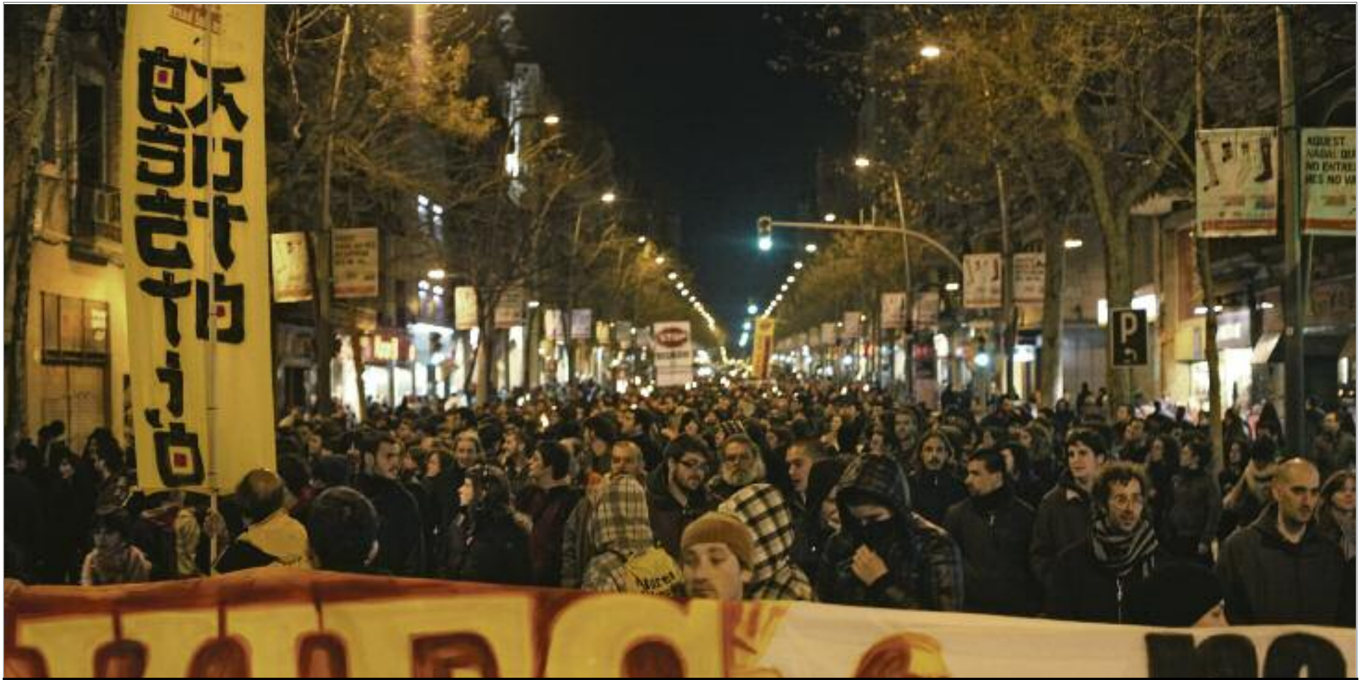
Capçalera de la manifestació de suport al CSA Can Vies, el 29 de gener a la tarda. Un miler de persones va voler estar present per cridar ben fort que Can Vies és del barri i a Sants es queda. ALBERT GARCIA