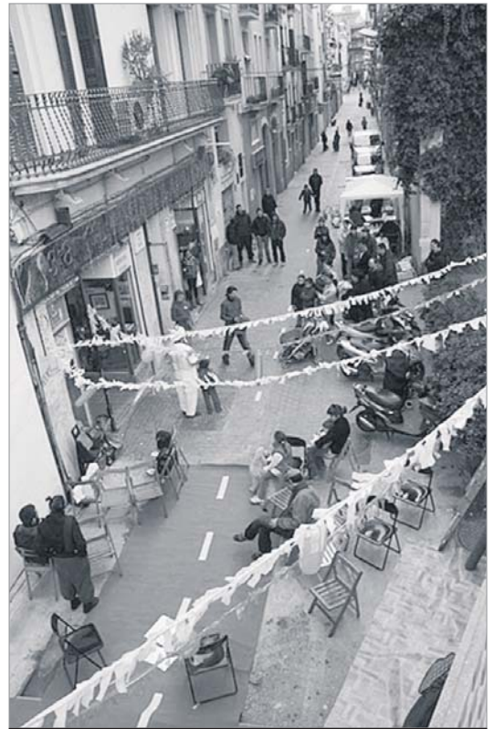
El carrer Riego vist des del passeig de Sant Antoni. CARLES BAIGES

Convocat pel col·lectiu d'arquitectes La Col, l'Assemblea de Barri i el Projecte Barri Cooperatiu, el 29 de gener se celebrava el primer taller sobre la Lleialtat Santsenca. La cooperativa de consum ubicada al carrer Olzinelles, 31, que va funcionar entre 1894 i 1941, va esdevenir posteriorment la sala de festes Bahía. Aquests i altres detalls es van exposar al taller on van participar diferents entitats santsenques i d'àmbit barceloní, que van po-