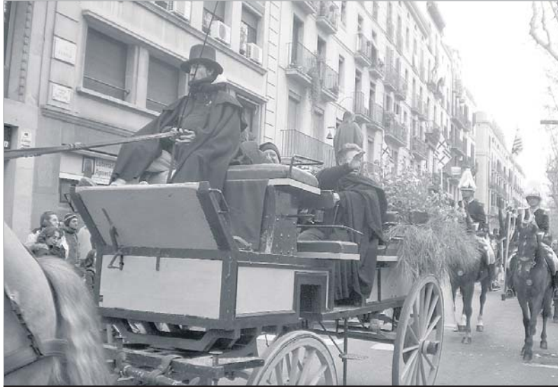
Els tres genets arriben al principi del carrer Ferran per dirigir-se a la plaça Sant Jaume, on va acabar la passejada. IJG

Si qualche cosa té aquesta passejada és la visibilitat de desenes i desenes de carros tirats per cavall i, fins i tot, per bous (com és el cas dels carros de pagès del Born i del Baix Llobregat). I, el més important,