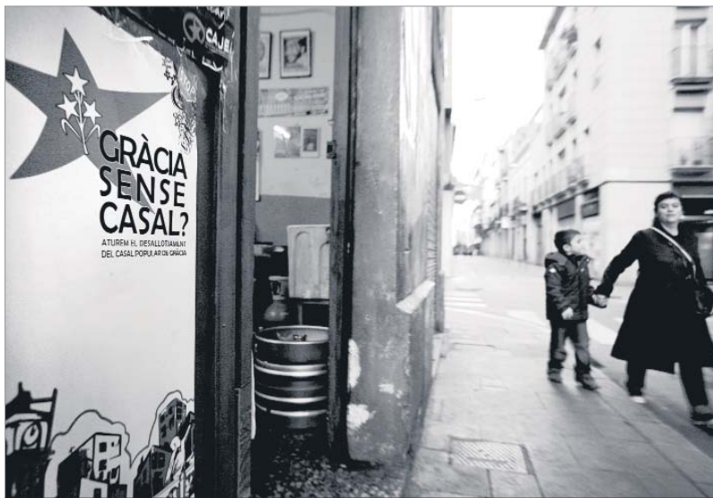
Entrada al Casal Popular de Gràcia, on veiem un dels cartells que denuncien el desallotjament. ALBERT GARCIA

El Casal Popular de Gràcia va néixer el 2 de febrer del 2002, quan l'Assemblea de Joves de Gràcia (AJG) va alliberar un petit local aleshores abandonat, que havia estat una perruqueria, una fusteria i finalment una perfumeria.