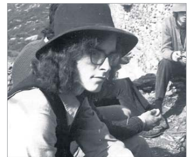
Foto de l'Esteve Fortuny extreta de l'arxiu de la Companyia Elèctrica Dharma.