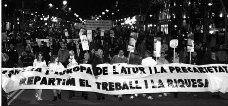
Manifestació contra les polítiques de la Unió Europea. JORDI BORRÁS