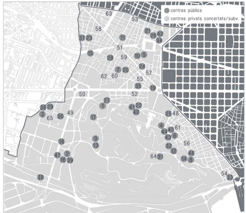
Centres educatius públics a Sants, Hostafrancs, la Bordeta i Badal. Escoles bressol: 5-Guinbó, 7-L'Esquirol i 10-Pau. Centres d'Educació Infantil i Primària: 11-Barrufet, 15-Cavall Bernat, 19-Francesc Macià, 20-Gayarre, 21-Jaume Primer, 23-Lluís Vives, 24-Miquel Bleach, 26-Ni de Pràctiques, 28-Perú. Instituts d'Educació Secundària: 34-Emperador Carles, 35-Joan Coromines, 37-Lluís Vives.

Barcelona era l'any 2006, segons el Síndic de Greuges, el municipi català amb més segregació escolar en l'educació secundària obligatòria i el tercer en l'e-