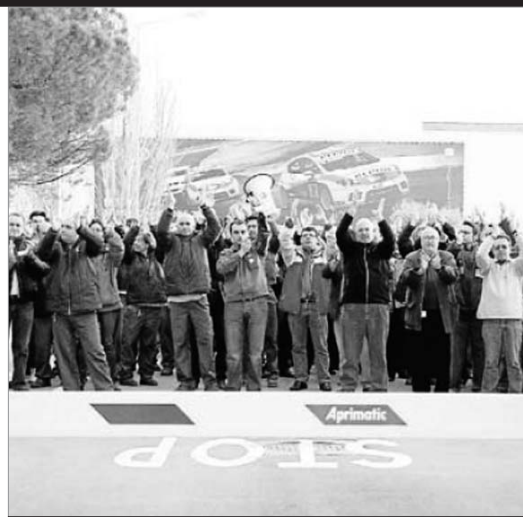
La plantilla de SEAT es mobilitza contra els acomiadaments.

SEAT va quedar pràcticament paralitzada, fet que va provocar la pèrdua de la producció de 1.600 cotxes i la inactivitat de 8.000 operaris a tota l'empresa. L'aturada es va mantenir també