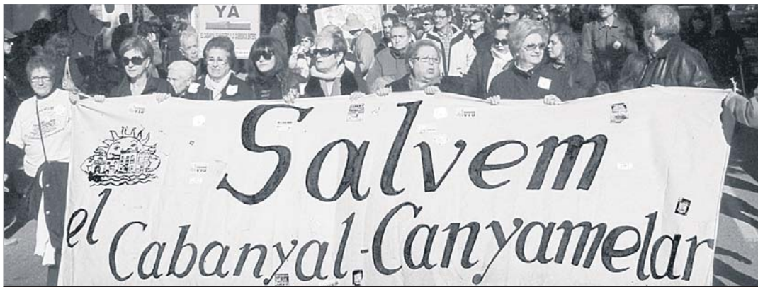
Capçalera de la manifestació del passat 31 de gener sota el lema "El Cabanyal és nostre i el volem sencer i viu". (H)

immediat, de les problemàtiques actuals, tant socials com ecològiques i econòmiques, i dels moviments populars que ens fan avançar.