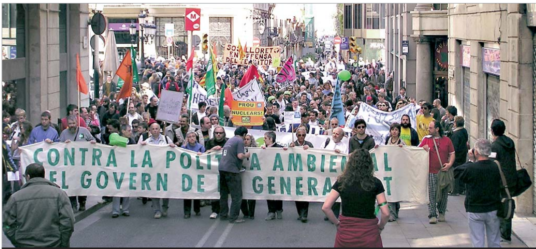
La manifestació contra la política ambiental del govern camí de la plaça Sant Jaume.