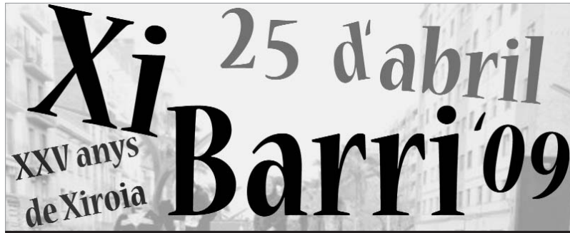
Imatge parcial del cartell del XI-Barri.

L'Agrupament Escolta i Guia Montserrat Xavier, una de les entitats veteranes de l'àmbit del lleure, viu enguany el 75è aniversari. Per tal de celebrar aquesta fita van organitzar el passat 21 de març una jornada infantil oberta al parc de l'Escorxador. Els nens, nenes i famílies que es van apropar al parc van poder gaudir d'una matinal de jocs ben completa, amb tallers, xocolatada i un final de festa amb el grup d'animació la Tresca i la Verdesca.