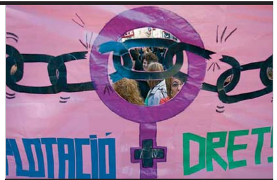
La Comissió 8 de Març s'oposa que amb la crisi es retallin els drets de les dones. INTERNET

Altres entitats del districte, com ara el Col·lectiu d'Artistes de Sants, Ona Nova (de la Zona Franca) i el Grup de Dones de Font de la Guatlà, així com el Punt d'Informació i Atenció a les Dones, van organitzar durant tot el mes de març exposicions, xerrades, cinefòrums i concerts. A Barcelona, hi va haver dues convocatòries de manifestació. D'una banda, la de la Comissió 8