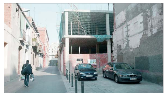
L'edifici envaeix la totalitat de la vorera, raó per la qual ha de ser enderrocat.

La notícia ha estat molt ben rebuda pel veïnat del carrer, que ja prepara una celebració per a mitjan abril i que afronta la nova fase de la seva lluita, relacionada amb el futur de l'immoble. Una de les opcions que s'està valorant és demanar al Districte que compri l'edifici i el destini a equipaments per al barri.