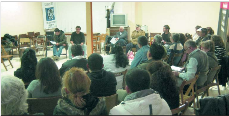
L'Assemblea d'Afectats per les Hipoteques, el 22 de febrer, a la Casa de la Solidaritat de Barcelona.