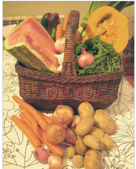
Les cistelles biològiques són una alternativa a les grans cadenes de distribució.

De la mateixa manera que uns pocs grups d'establiments controlen més del 50% del mercat alimentari espanyol, un grapat de multinacionals monopolitza gran part dels productes que podem trobar en els seus locals. I si ens preguntem «Qui ha elaborat el producte que comprem?» o «Amb quins impactes socials i ambientals?», poca informació en trobarem a les etiquetes.