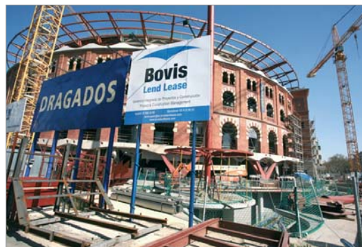
Les obres estan inacabades i no es veu cap operari treballant-hi. ALBERT GARCIA

Dragados, l'empresa constructora principal, va decidir aturar les obres al·legant la falta de pagament per part del promotor del projecte, Metrovacesa. Dragados no reiniciarà els treballs fins que no cobri la factura pendent, fet que pot suposar que la finalització de les obres s'endarrerixi un any. Per la seva part, Metrovacesa nega que hi hagi un problema de pagaments i atribueix el problema al canvi de propietat, ja que la immobiliària