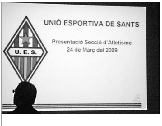
Acte de presentació de la nova secció de la Unió Esportiva de Sants. NEUS I SERGI

El passat 24 de març va tenir lloc, a les Cotxeres de Sants, la presentació de la nova secció d'atletisme de la Unió Esportiva de Sants.