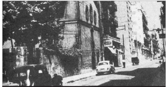
Imatge del carrer Parcerisses l'any 1961.