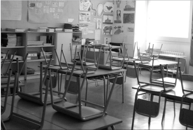
Aula buida del CEIP Barrufet amb motiu de la jornada de vaga del passat 19 de març. IRENE

El 19 de març el conflicte per l'aprovació de la Llei catalana d'educació (LEC) va viure un nou capítol. Sota una convocatòria unitària, els sindicats convidaven tota la comunitat educativa a mostrar el seu rebuig a la nova llei projectada pel Departament d'Educació, encapçalat per Ernest Maragall.