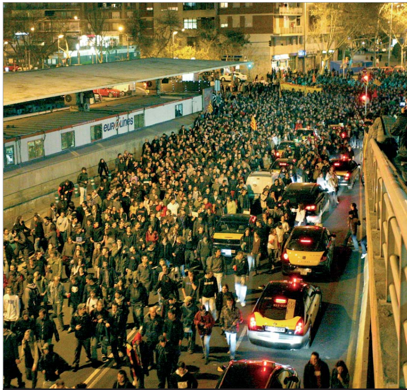
Vista de la manifestació en contra de l'actuació del Mossos d'Esquadra del 26 de març des de l'estació de Sants. ALBERT GARCIA

D'altra banda, també hi ha hagut mobilitzacions en contra de l'anomenat Pla Bolonya. El 18 de març es va dur a terme el desallotjament del rectorat de la Universitat de Barcelona a càrrec dels Mossos d'Esquadra. L'actuació violenta de la policia va provocar concentracions durant tot el dia i una manifestació a la nit. La jornada es va saldar amb més d'un centenar de ferits, entre manifestants, periodistes i gent aliena a la convocatòria. A causa d'aquests fets, el dia 26 es va dur a terme una manifestació de denúncia que va aplegar més de 10.000 persones i que va arribar fins a la plaça d'Oscà. PÀGINES 3 i 5