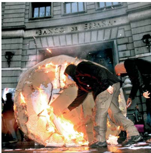
Crema d'un euro per denunciar del paper dels bancs en la crisi. MIRTA

La segona passa per la retirada de confiança en aquests gestors i prendre una actitud activa. Actitud que es pot plasmar de moltes maneres diferents: retirant els diners del banc per assenyalar la seva col·laboració necessària en aquesta crisi; apostant per altres estructures o maneres de gestionar els diners, des de les cooperatives de finançament ètic fins a banques ètiques, xarxes de solidaritat o les velles caixes de