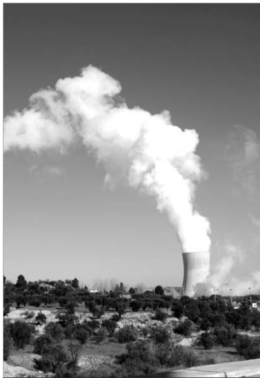
Imatge de la central nuclear d'Ascó I, a la Ribera d'Ebre.

immediat, de les problemàtiques actuals, tant socials com ecològiques i econòmiques, i dels moviments populars que ens fan avançar.