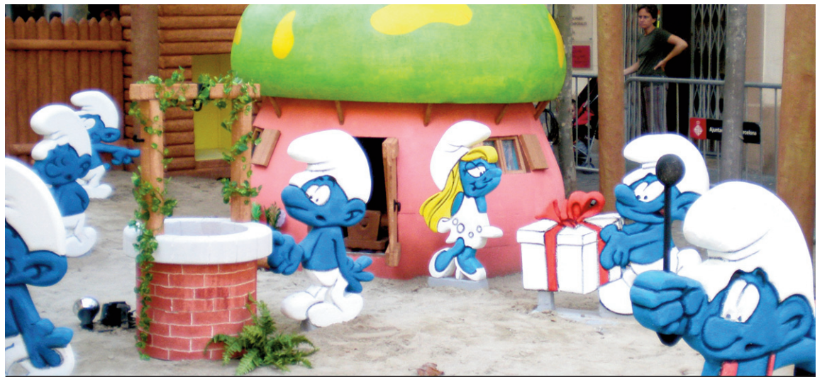
Detall de la decoració del carrer Valladolid, que recreava la vila dels barrufets.

Com a apunt negatiu, expliquen que el decorat del carrer Vallespir anava desapareixent a mesura que passaven els dies... I és que hi ha gent que es dedica a arrabassar decorats!