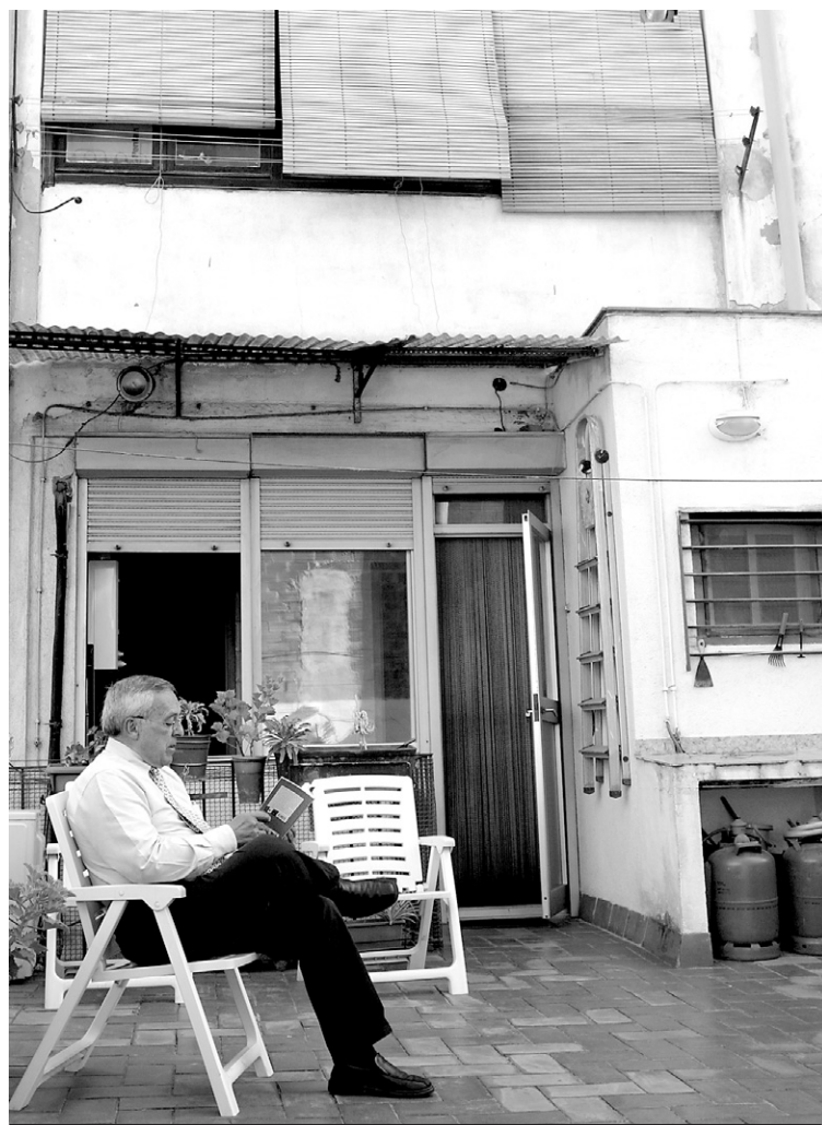
Terrassa on suposadament, i segons la propietat, no es pot accedir pel perill que suposa el seu estat. NATÀLIA RAMOS

Els veïns, gairebé tots pensionistes o jubilats, afirmen que «lluitaran fins al final» i, a més d'haver buscat el suport de diverses entitats del barri, han fet públic el seu cas i han penjat una pancarta a l'edifici. També han demanat una entrevista al fiscal antimobbing .