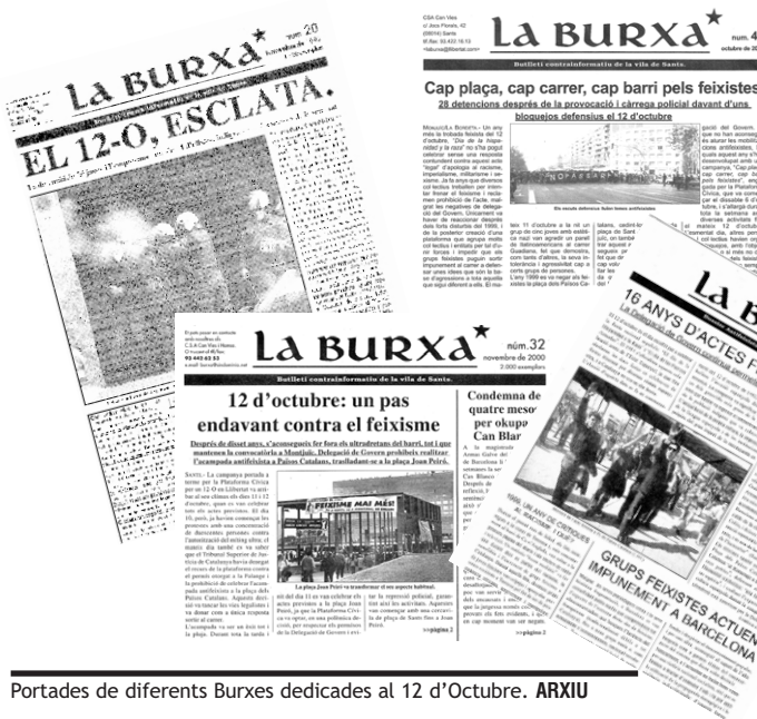
Portades de diferents Burxes dedicades al 12 d'Octubre.

Però des del 1988 la resposta antifeixista ha estat clara. Ahir com avui no es vol un acte de caire racista a la ciutat. I és que en aquestes concentracions se