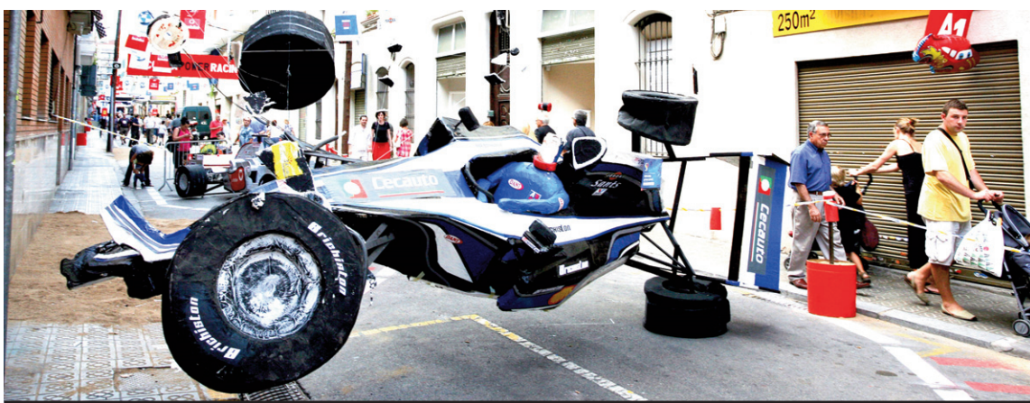
Imatge del carrer Alcolea de Dalt, que es va endur el primer premi de guarniment de carrers.

nits al carrer. La comissió organitzadora es declara «molt engrescada» per les festes d'enguany, ja que fa dos anys la comissió va plegar i ara els nous membres que van agafar el relleu tenen moltes ganes de continuar.