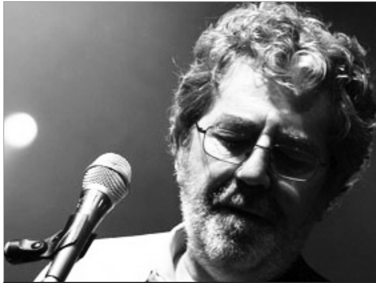
Quico Pi de la Serra en concert.

Al concert que oferirà als Divendres de Faràndula, Pi de la Serra interpretarà temes dels seu últim disc Tot i altres cançons de la seva extensa discografia (20 discos en solitari durant 47 anys de carrera artística), a més