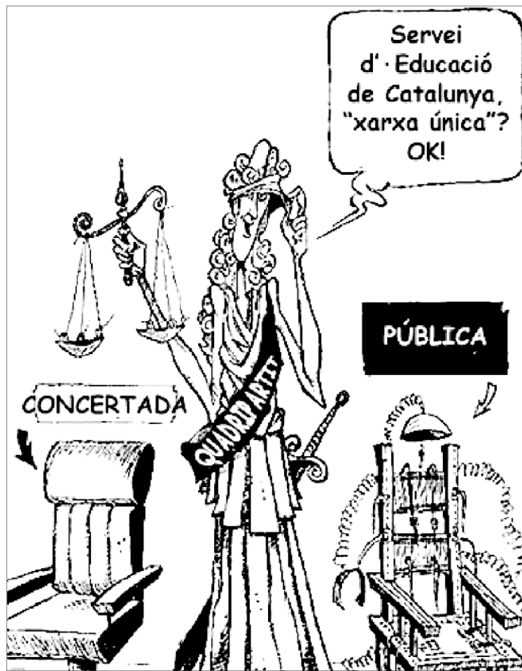
Imatge extreta d'un tríptic de la CGT per informar la comunitat educativa del contingut de la LEC. CGT

Per descomptat, davant d'aquests greus esdeveniments una part subs-