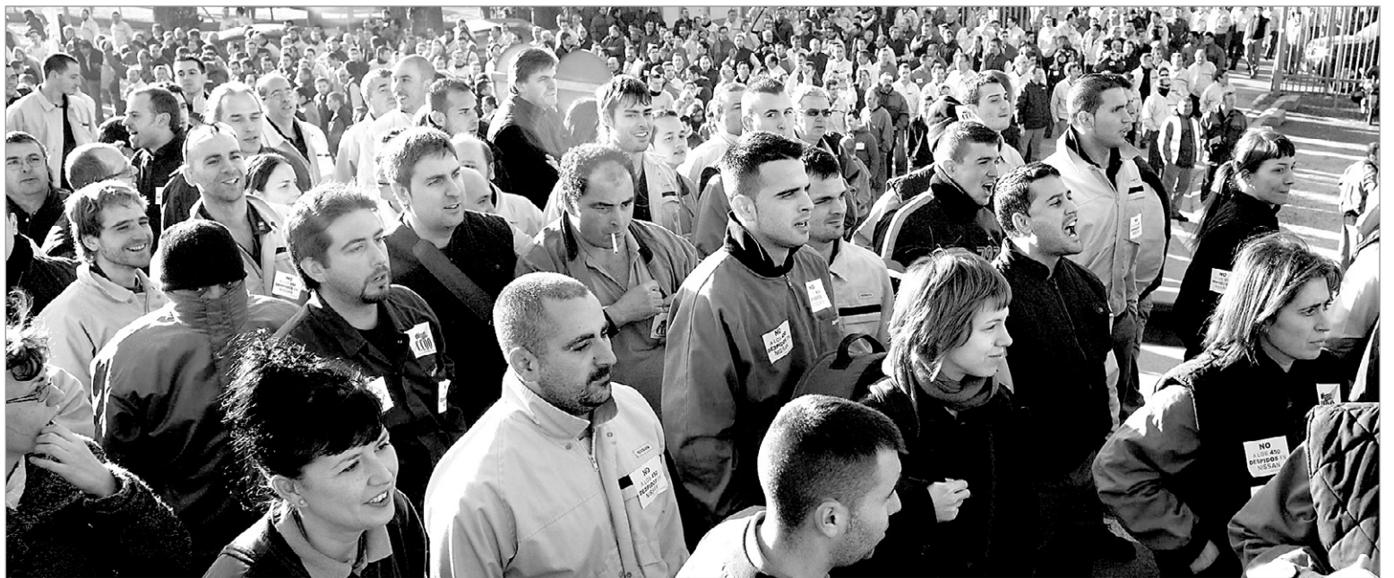
Mobilitzacions contra l'expedient de regulació presentat per Nissan el gener del 2008.

Des de ja fa uns mesos, la tan reiterada crisi posa en perill els llocs de treball de centenars de veïns del districte, com ja va passar en els darrers anys en els casos de Frape Beher, Miniwatt i Ferraz.