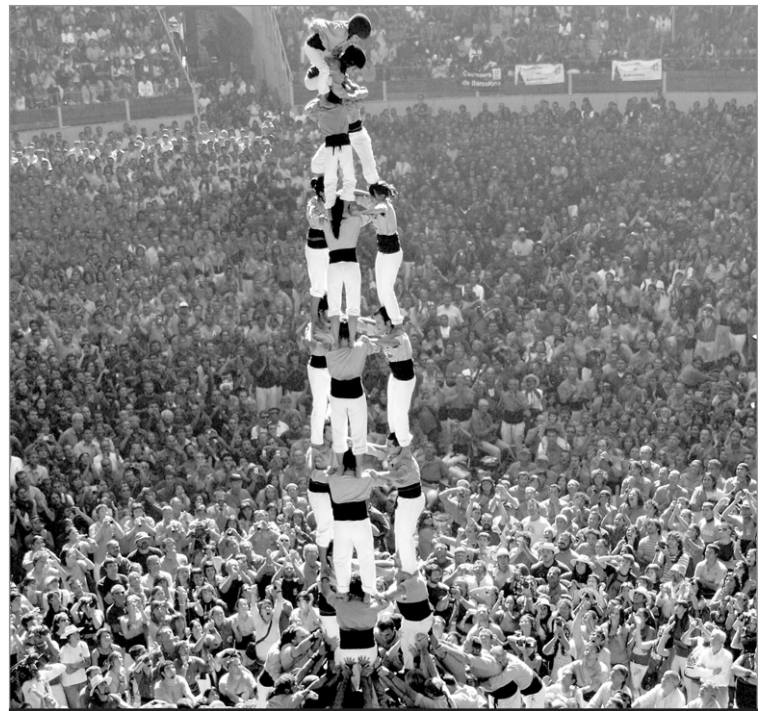
Imatge del 3 de 9 amb folre dels Castellers de Sants.