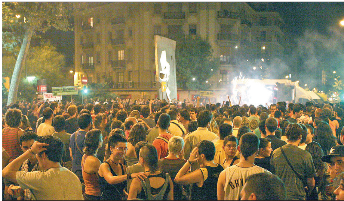
Imatge que presentava plaça de Sants durant el correfoc del dissabte a la nit.

La darrera setmana d'agost el barri es va posar les seves millors gales. La Festa Major va inundar els carrers i les places, però la falta d'un espai per a la Festa Major Alternativa de Sants (FMA) va fer que aquesta prengués el protagonisme durant el cap de setmana amb un model nòmada.