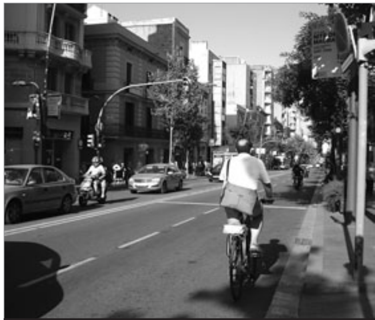
A carretera de Sants no hi ha carril bici. JORDINA