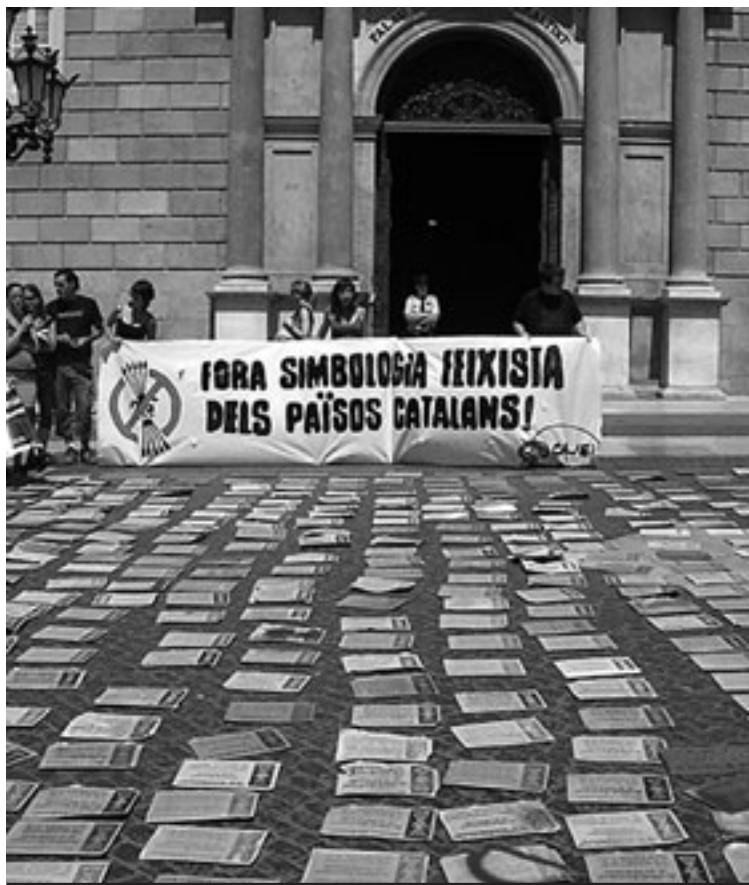
Acció de lliurament a l'Ajuntament de totes les plaques franquistes retirades.