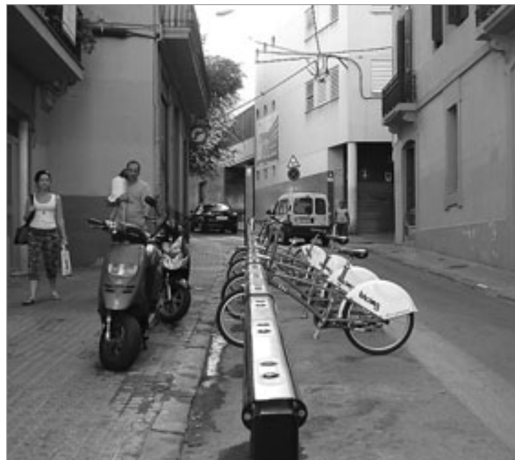
Estació de Bicing al carrer Sant Crist. JORDINA

Com ja ha recollit LA BURXA diverses vegades, aquesta depauperació de les rodalies es deuria a la inversió que s'ha destinat al Tren d'Alta Velocitat.