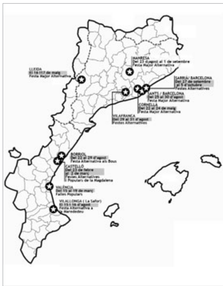
Mapa dels Països Catalans amb les diferents Festes Majors de la Coordinadora i les seves respectives dates. BERNAT-(H)

Els requisits que es demanen és que el finançament de les festes no provingui en cap percentatge d'entitats oficials o privades que posen en compromís la independència i l'autonomia dels projectes, que en l'organització d'aquestes no hi participin partits polítics ni ONG vinculades directament a aquests, que siguin models organitzatius horitzontals/assemblearis i que tots els beneficis que puguin generar les festes es destinin a iniciatives de caire polític, social i/o cultural.