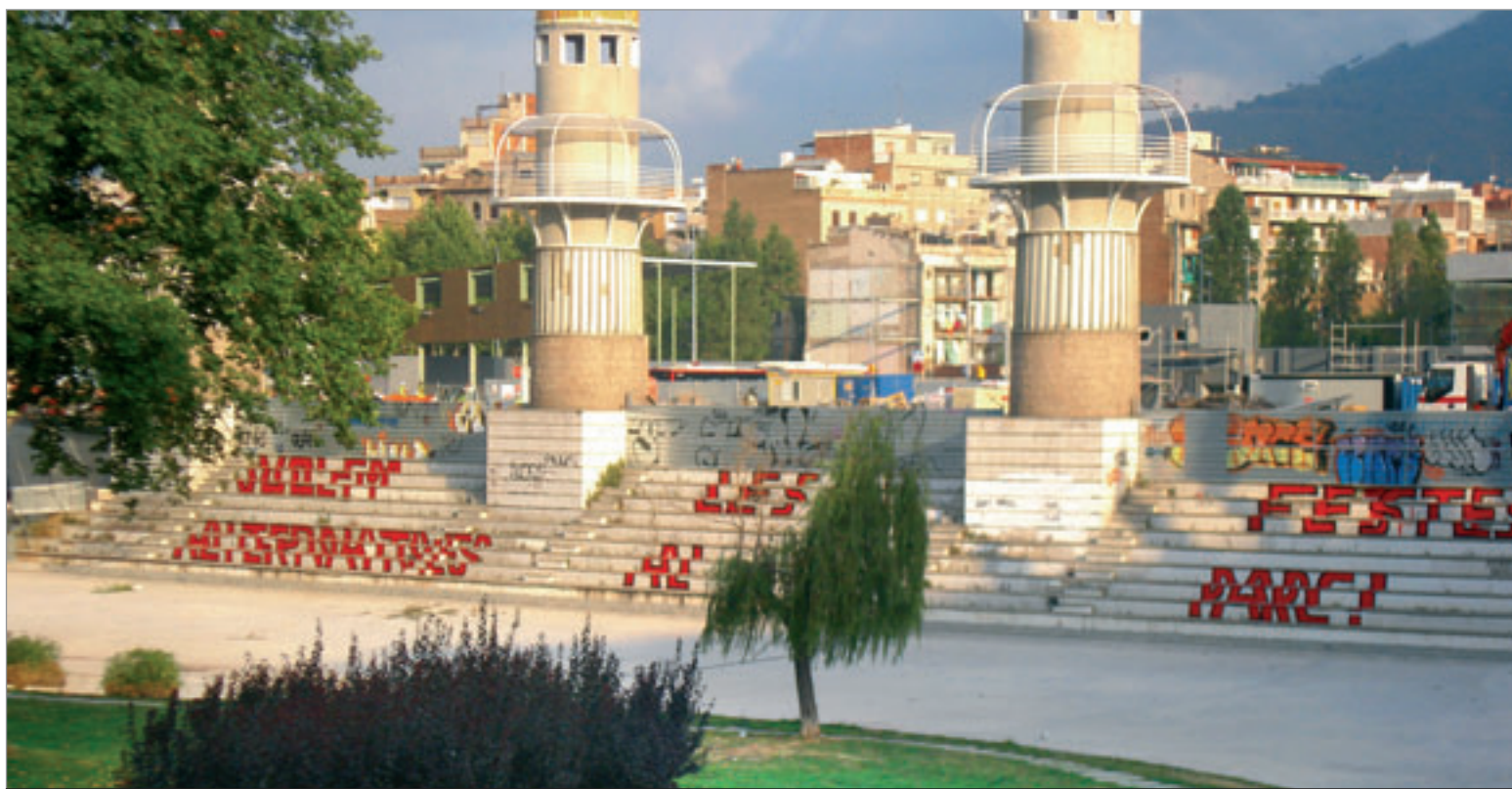
Les escales del Parc de l'Espanya Industrial aparegueren el passat 29 de juliol amb una pintada en la que es podia llegir «Volem les festes alternatives al parc!». DAVID

Amb l'arribada del bon temps torna la festa major. Del 24 al 31 d'agost, Sants es vestirà de gala per acollir nombroses activitats. L'alegria i la il·lusió s'apoderaran de 15 carrers i places diferents, on veïns i veïnes porten mesos treballant perquè tot estigui a punt per aquesta celebració.