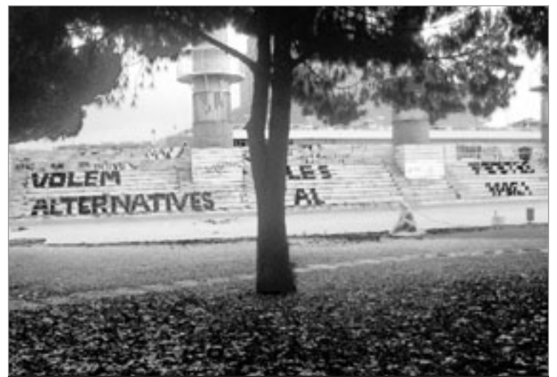
Pintada apareguda a l'Espanya Industrial que reclamava el parc per a la Festa Major Alternativa. DAVID

Per altra banda, el Centre Social de Sants, la Comissió de Veïns de la Bordeta i la Federació d'Associacions de Veïns de Barcelona (FAVB) han signat un manifest en què es recolza la petició del parc.