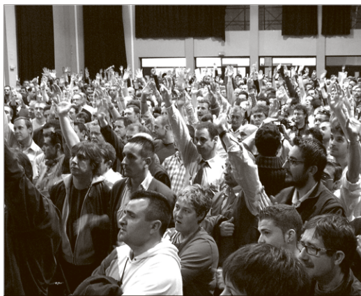
Assemblea de treballadors dels autobusos de TMB al Casinet d'Hostafrancs. ALBERT GARCIA

Els vaguistes van qualificar d'inacceptable i mediàtica la proposta de TMB que suposa l'augment de 41 minuts de treball diaris, la pèrdua de festius els caps de setmana i una rebaxa salarial. Paral·lelament, s'ha presentat una plataforma d'usuaris en suport a la vaga.