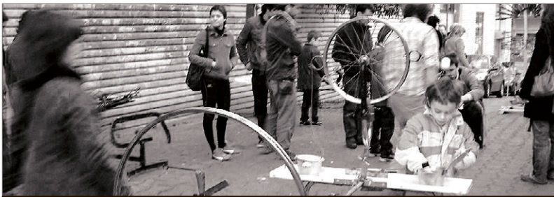
Jocs amb materials de recuperació. INÉS DE FEZ

El dissabte 15 de març el carrer de Sants estava, com de costum, ple de gent consumint compulsivament. Alhora, a Cotxeres hi havia un centenar de persones que es pararen a reflexionar sobre com canviar aquesta realitat tot decreixent.