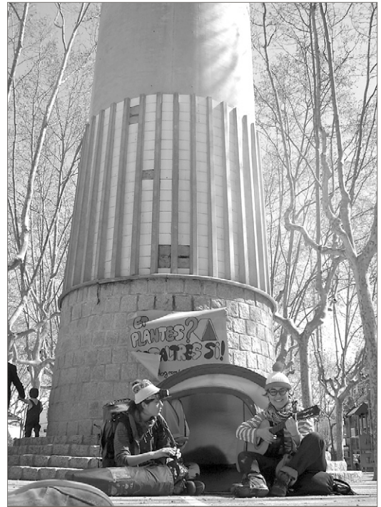
Acció per difondre l'AcampaSants i contra la prohibició del Districte. CAMPANYA ENS PLANTEM

Els caus i els esplais han decidit no signar-se i reformular la jornada d'educació en el lleure en un format més sen-