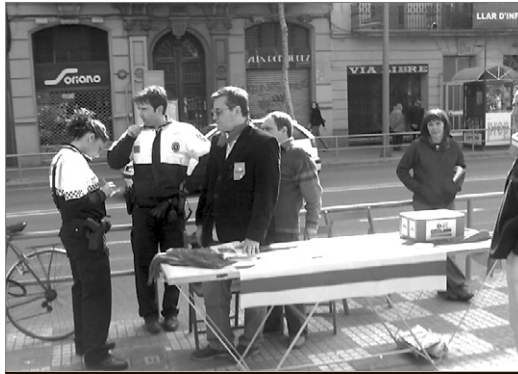
La Guàrdia Urbana identificant els membres de la taula de plaça de Sants. MARTÍ

A molts municipis del territori català les forces policials van actuar amb con-