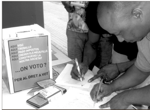
Recollida de firmes pel dret de vot a Salt. DIRECTA GIRONA

Des de l'any 2002, la Comissió pels Drets Socials i Polítics de la Coordinadora d'ONG Solidàries de les comarques gironines i l'Alt Maresme treballa per exigir el dret a la participació política de la població immigrada. Es vol posar de manifest que l'Estat espanyol no permet el dret de vot a moltes persones que