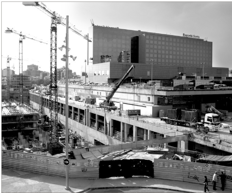
Obres a la rodalia de l'estació de Sants. NATALIA RAMOS

En aquest sentit, el passat dia 10 es va obrir la nova seu de l'oficina de l'habitatge de Sants-Montjuïc, ubicada a la seu del Districte, que, entre altres coses, s'encarregarà de la gestió de les àrees de rehabilitació inte-