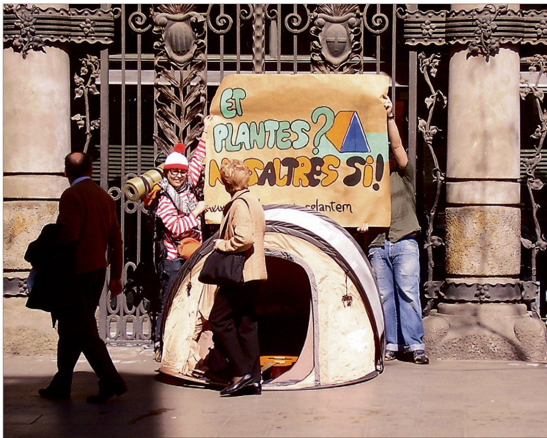
Plantada davant de la seu del Districte de Sants-Montjuïc. CAMPANYA ENS PLANTEM

Els agrupaments i esplais de Sants tenien previst fer una activitat innovadora: una acampada nocturna al parc