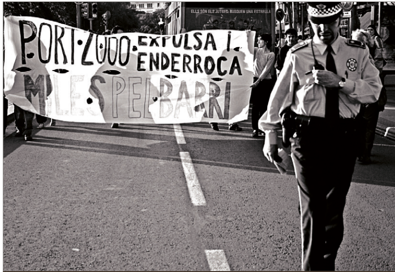
Capçalera d'una manifestació en defensa del barri de la Barceloneta convocada pel col·lectiu Miles de Viviendas. ARCKETIPO

immediat, de les problemàtiques actuals, tant socials com ecològiques i econòmiques, i dels moviments populars que ens fan avançar.