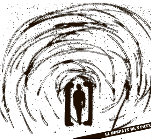
EL DESPATX DE N PATX

Ja seria hora que la gent canviés aquestes actituds tan egoistes i individuals i s'acostumés a ser més tolerant i, al mateix temps, saber ajudar