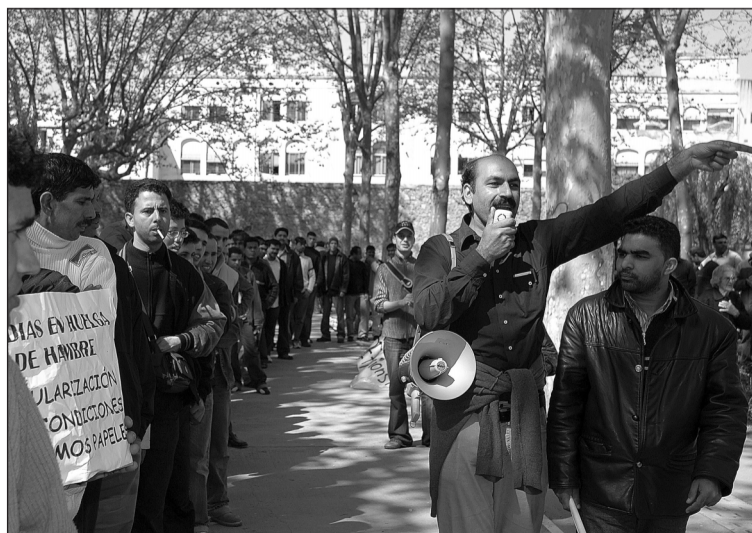
Concentració al Districte de Sants en demanda d'una veritable flexibilització del padró.

Altres accions han fet visible al carrer la lluita pels drets dels immigrants. El dimarts 19 d'abril després d'una assemblea pública a la rambla del Raval es va fer una manifestació espontània fins a la plaça de Sant Jaume. Especialment exitosa va ser la manifestació del 24 d'abril que va recórrer amb molta energia el centre de Barcelona. La setmana següent es va participar a la manifestació del primer de maig, el