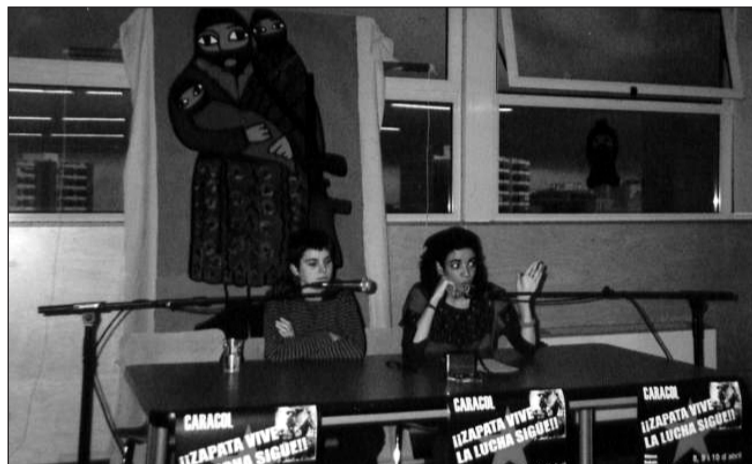
Moment d'una xerrada de les Jornades.