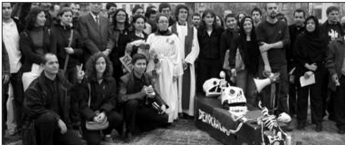
Moment de la manifestació a Barcelona.

López Obrador pertany a l'esquerra Partit de la Revolució Democràtica, i des que el 2000 aconseguí l'alcaldia, ha anat guanyant suport popular, i l'ha fet decidir-se a optar per la