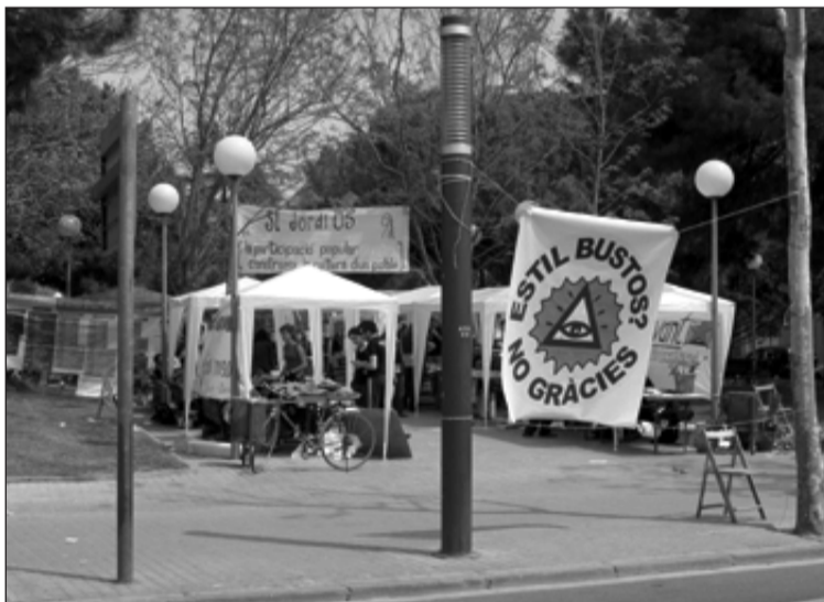
Pancarta de la campanya del veïnat contra la política municipal. ORDINT LA TRAMA

pendències policials després que la recentment creada Brigada d'Intervenció Ràpida de la Policia Municipal s'estrenés en les seves funcions carregant contra el jovent que es concentrava al voltant de l'esmentat bar. La Brigada fou auspiciada sota el pretext de combatre la violència de signe neonazi a la ciutat. El resultat de l'actuació fou una manifestació sota el lema "Prou violència institucional, absolució detinguts" i la imputació del regi-