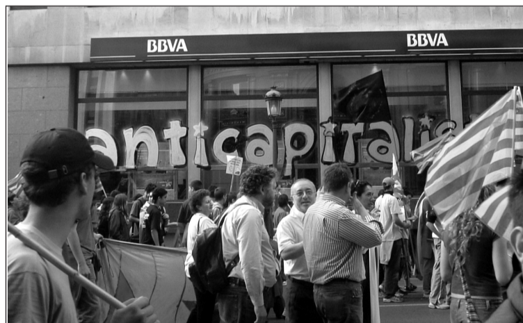
Acció a la manifestació del 30 d'abril a València.