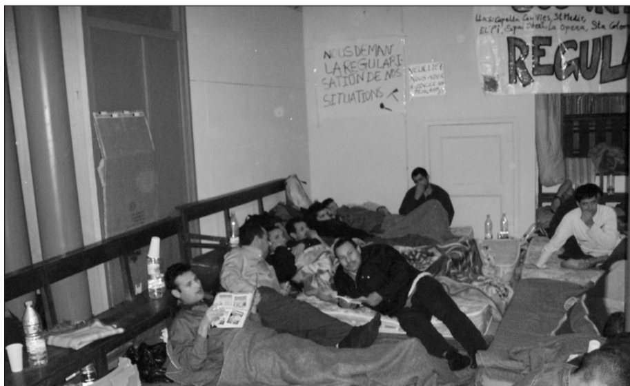
Tancats a Can Vies.