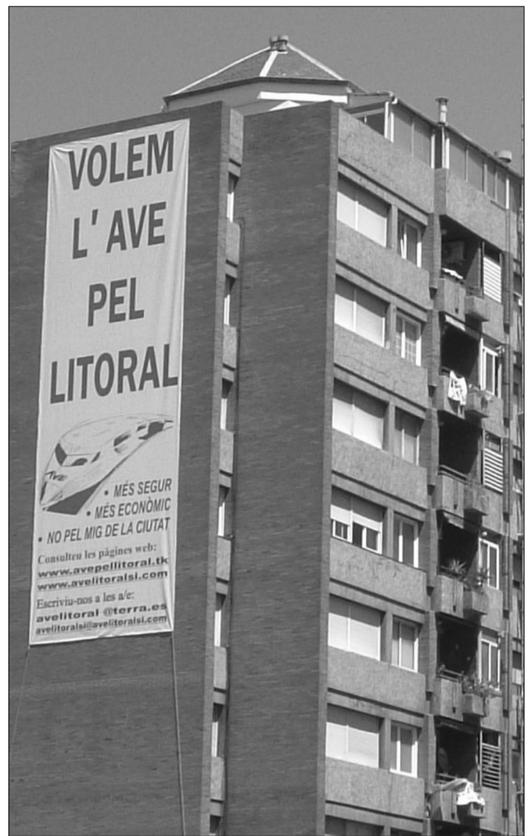
Pancartes de totes les mides reclamen el pas del TAV pel Litoral.