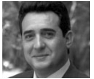
La família Bustos segueix amb el seu estil feudal al capdavant de l'alcaldia de Sabadell.