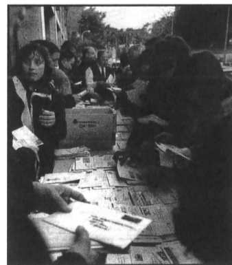
Classificant cartes al carrer

Prop de 50 treballadors i treballadores de la central de Correus de Sants-Les Corts van treure el passat 17 de novembre les taules de classificació de cartes, al carrer. L'acció de protesta pretenia denunciar les condicions indignes en les que han de treballar en aquesta oficina (per les instal·lacions molt degradades que tenen). D'altra banda, també volien exigir un augment de plantilla per poder afrontar el servei de classificació tot i l'augment de població de la zona de repartiment.