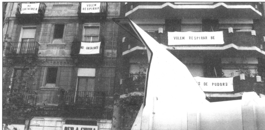
Pancartes contra les pudors, a l'edifici més proper del polèmic contenidor

La pudor que genera el contenidor i la manca de solucions indigna al veïnat