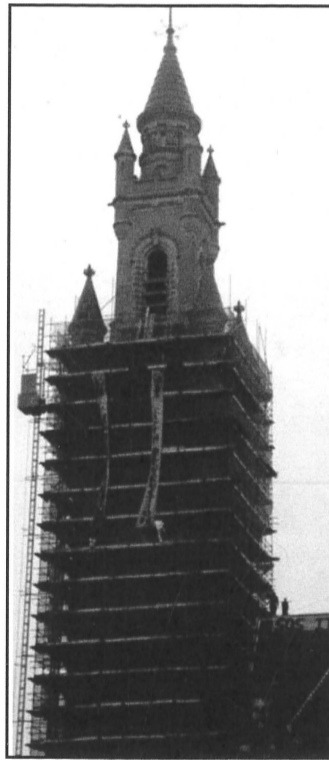
Pancartes desplegadas a la torre

LA HAIA. Divendres 25 membres de "Solidari@s con Itoiz" es penjaren a la torre i s'encadenaren a la valla del Tribunal Internacional de Justícia per denunciar la condemna de 5 anys de presó que pesa sobre 8 activistes des del passat setembre. L'acció, malgrat ser de caire pacífic, acabà amb detencions.