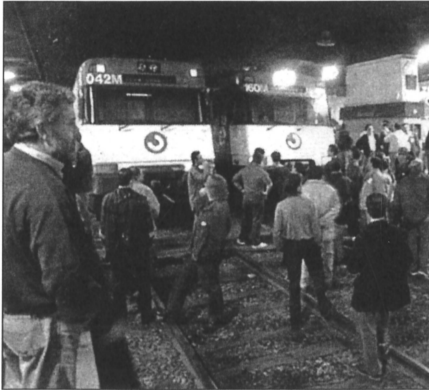
El tall de vies va durar prop de 20 minuts

Després que la direcció de RENFE decidís actuar de forma repressora i venjativa en contra dels treballadors i treballadores de l'empresa que van participar en les mobilitzacions del passat mes, tots els sindicats van unir esforços per denunciar la direcció de RENFE, convocant una jornada de vaga i explicant públicament en que