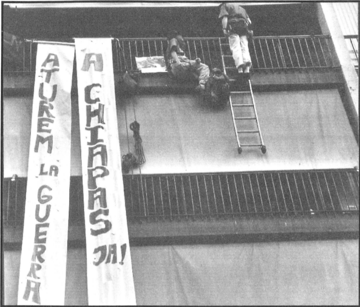
Membres del Col·lectiu de Solidaritat penjats del balcó del Consulat Mexicà.

L'acte es va fer en un dia de lluita mundial per la pau a Chiapas.