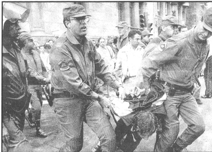
La policia nacional mentre detenia gent al carrer el passat 28/10/96

El passat dimecres dia 30 de juny, es va fer al jutjat penal nº5, el judici contra set persones que van ser detingudes el 28/10/96, a les rodalies del Cinema Okupat de Via Laietana, mentre la policia l'estava desallotjant. Els i les afectades van presentar-se al judici, exceptuant una de les persones que no es trobava a Barcelona. Durant el judici, l'única acusació era la dels testimonis dels agents de la Policia Nacional que els van detenir. Però durant les declaracions d'aquests policies (de paísà), tots ells es van contradir de forma escandalosa, i va quedar clarament demostrat que les detencions es van produir per una discriminació ètnica (en paraules d'un dels policies: "tenian estètica okupa"). Per això, a mig