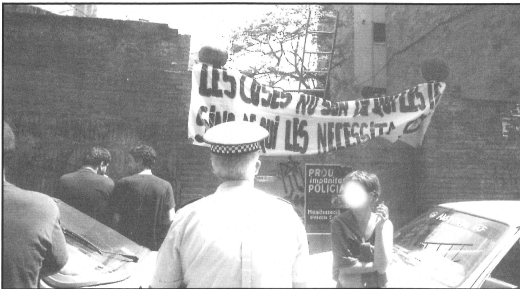
La Guàrdia Urbana va aparèixer davant de la casa okupada al c/Sugranyes, en pocs minuts.

Una cercavila d'un es 80 persones, va sortir el passat dissabte 3 de juliol, des de la Pl. Màlaga. La marxa festiva i amenitzada amb tambors, va arribar fins una finca abandonada situada al c/Sugranyes 17, per tal d'okupar-la i rehabilitar-la. Es tracta d'una antiga masia, on no hi viu ningú des de fa més de 20 anys i que pertany a una rica família de Sants que la manté abandonada. El grup de joves del barri que s'hi ha quedat a viure, pretén arreglar i netejar les parts més degradades. Volen optar així a accedir a una vivenda digna tot denunciant l'especulació dels espais abandonats.