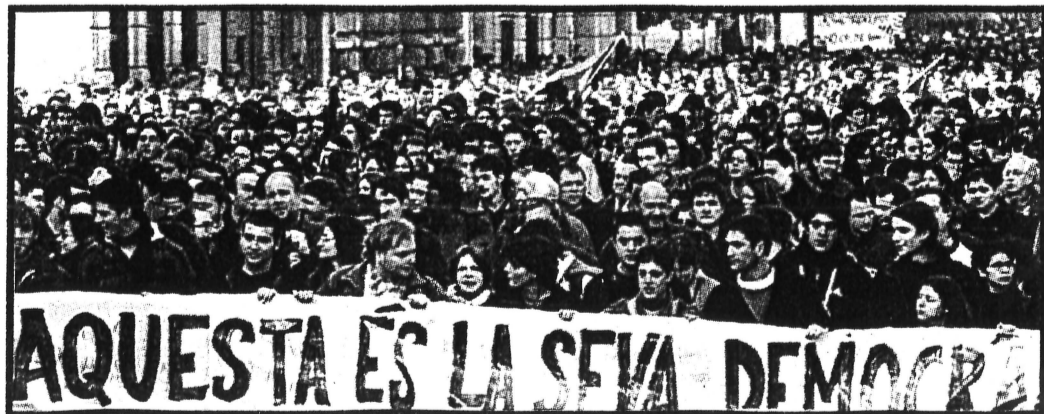
Moment en que la multitudinària manifestació del dia 15 baixava per la Via Laietana de Barcelona.

però aquest cop enmig d'una universitat i amb els mitjans de comunicació al davant. L'agressió de la policia va provocar més de 20 ferits/des (entre els que hi havia 2 professors i dos treballadors del campus). Com a resposta als fets, el 15 de gener unes 8.000 persones es van manifestar pel centre de Barcelona, fins arribar a la Delegació del Govern, on es van llençar ous, ampolles i escombraries.