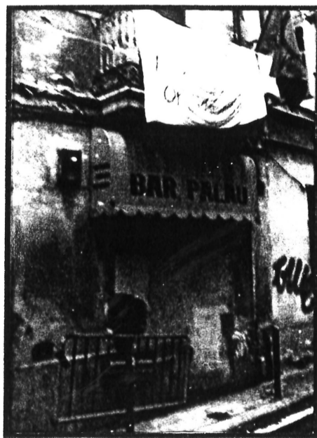
Façana de l'okupació de Melcior de Palau

La segona okupació ha estat al nº11 del carrer Noguera Pallaresa, on una vintena de persones el migdia del passat dissabte 16 de gener van recolzar a la gent que okupava l'edifici. En principi sembla ser que serà rehabilitat i utilitzat com a vivenda. En tots dos casos els edificis portaven molts anys abandonats, per això, hi ha molta feina de neteja, i els/les okupants demanen la solidaritat de tothom qui pugui passar a ajudar-los o a dur-hi eines o estris.