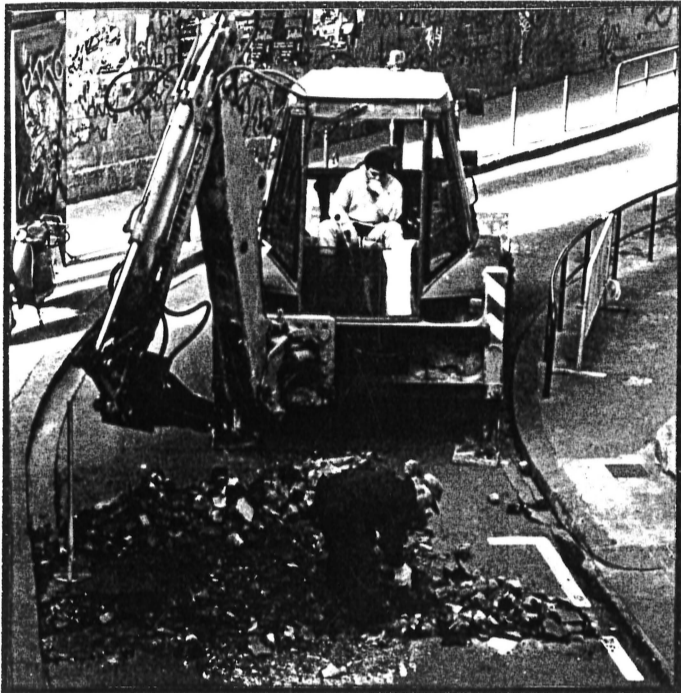
Moment en que l'excavadora va topar amb el túnel del Metro.

Si heu voltat pel barri últimament us haureu adonat que des de fa uns mesos estan tots o quasi tots els carrers aixecats, des d'aquesta redacció encara no ens expliquem a que es deu. La veritat és que s'han produït situacions d'allò més estranyes com els paletes que van començar a aixecar la calçada del carrer Jocs Florals i a pesar dels avisos d'un veí del carrer es van trobar amb el sostre del metro, després de consultar amb els seus "superiors" van suspendre la feina i van reprendre-la al lloc correcte, no hi ha prou obres per que a sobre aixequin trossos de carrers que no s'han d'arreglar. A la Gran Via trobem també un fenomen estranyíssim, després d'estar-s'hi dos anys fent la vorera nova i construint la nova