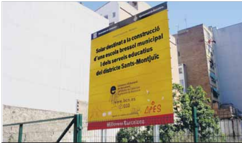
Solar del carrer Olzinelles on hi havia hagut l'habitatge ocupat La Torreta i on es construirà l'escola bressol. MARTÍ GUTIÉRREZ FARRÉ

Després de l'aprovació de les obres, l'espera per l'estrena de la nova escola s'allargarà fins al curs 2010-2011.