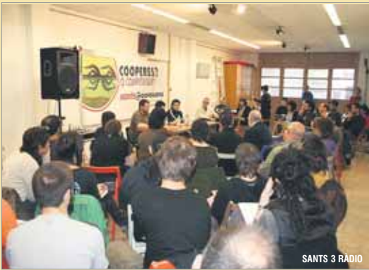
SANTS 3 RADIO

El 30 d'abril es va presentar una iniciativa impulsada per la Federació de Cooperatives de Treball de Catalunya i la Ciutat Invisible. Amb aquest projecte es vol promocionar i donar suport a les cooperatives com a entitats de treball, de consum o d'habitatge, entre d'altres.