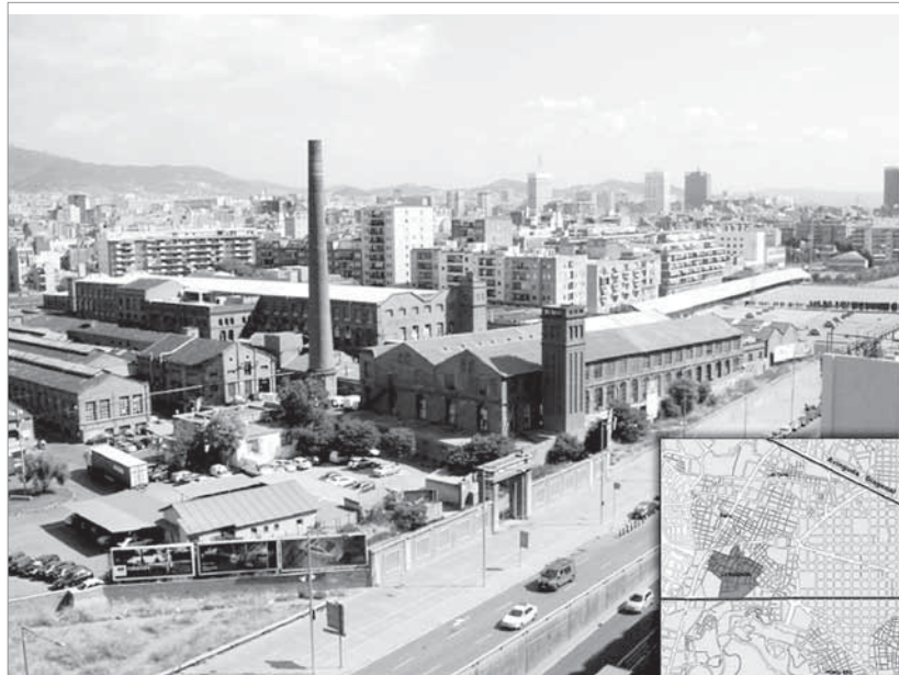
La transformació de Can Batlló en equipaments ha estat una de les reivindicacions històriques del moviment veïnal de la Bordeta.

Un altre aspecte polèmic és la remodelació de la ludoteca: els membres del teixit associatiu no entenen que no s'aprofitin les reformes de l'equipament