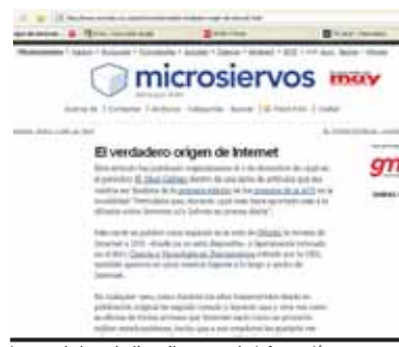
Imatge de la web d'on s'ha extret la informació.