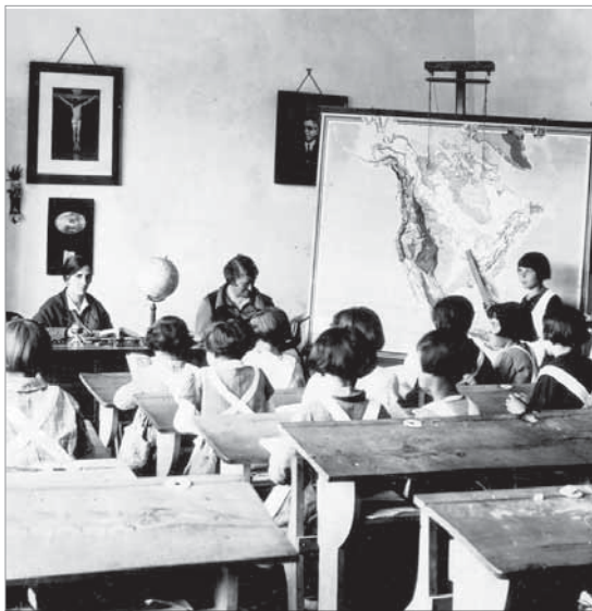
Imatge d'una escola republicana.

La fi de la República pel cop d'estat militar es va commemorar al Casinet amb L'escola afusellada , un documental sobre un model educatiu que el franquisme va reprimir brutalment, eliminant tota una generació de docents.