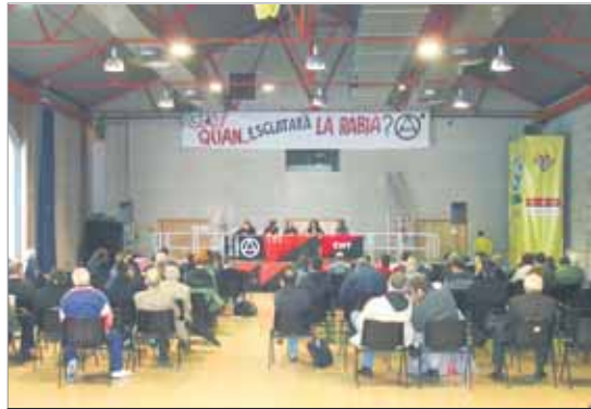
Imatge de l'acte organitzat per la CNT a l'auditori de les Cotxeres de Sants.

Però el Primer de Maig no només va estar marcat per manifestacions.