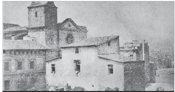
Imatge de Sta. Maria de Sants