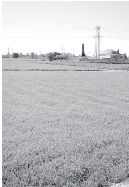
Vista de la masia de Can Trabal i els seus voltants. INTERNET

Alhora, també s'ha pronunciat la Comissió del Riu del Consell de la Sostenibilitat de l'Hospitalet. Davant la manca d'informació per part de les administracions, la comissió va el-