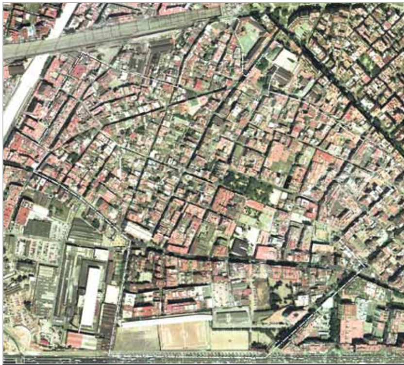
imatge panoràmica de la zona que està inclosa en les actuacions de la Llei de barris de la Bordeta.

Des de l'Ajuntament i la Generalitat es pretén corregir aquests déficits amb una inversió de 14,7 milions d'euros, aprovada l'any 2007 i que suposarà que el barri estigui immers en un procés de reforma fins al 2011. Tot i que moltes de les actuacions projectades responen a reivindicacions històriques del teixit associatiu del barri, s'han planificat sense comptar gaire amb la seva participació. Per aquesta raó les entitats reclamen que, més enllà de la comissió de seguiment en què ja participen, tot el veïnat pugui participar en el procés de reforma i vetllar perquè aquesta estigui subjecta als seus interessos i les seves necessitats. Pàgina 3